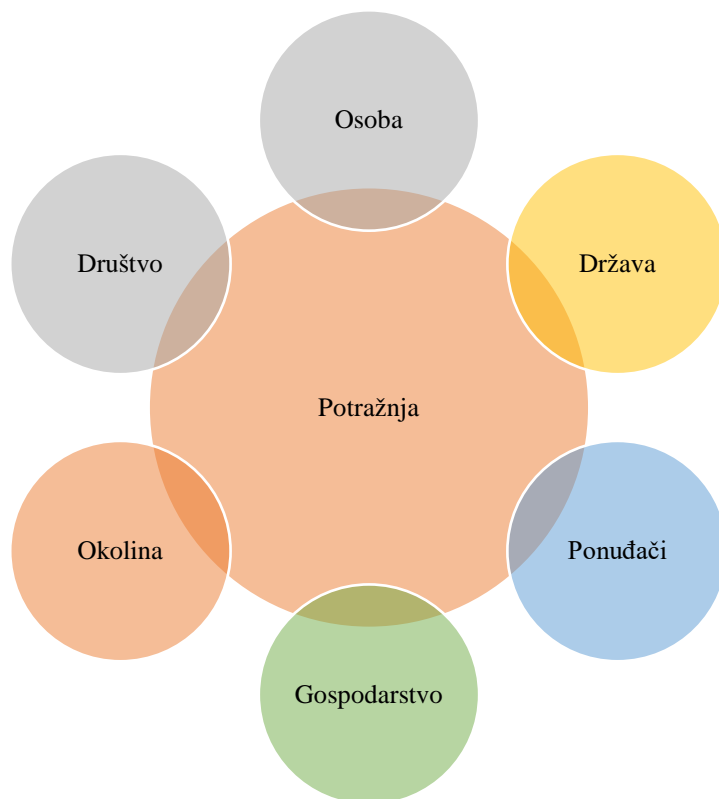
Slika 2: Čimbenici utjecaja turističke potražnje

Na slici 2., prikazani su čimbenici utjecaja na turističku potražnju.