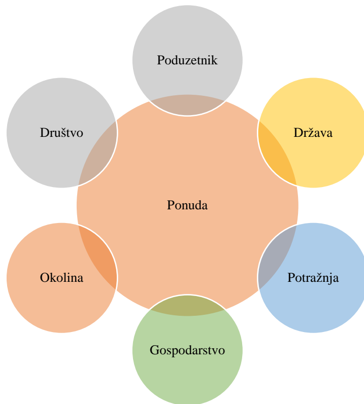
Slika 1: Čimbenici utjecaja turističke ponude

Na slici 1., iskazani su čimbenici utjecaja na turističku ponudu.