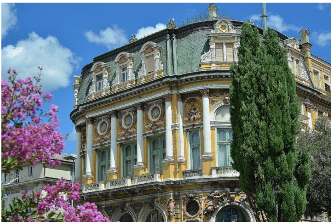
Immagine 7. Il Palazzo Modello di Fiume

I famosi architetti Ferdinand Fellner e Herman Helmer, già autori del progetto del teatro di Fiume “Ivan Zajc”, progettaron anche la sede di Palazzo Modello, costruito tra il 1883 e il 1885, con destinazione d’uso sia commerciale che residenziale. Il palazzo è influenzato dalle correnti neobarocche e rinascimentali, essendo ricco di ornamenti scultorei a rilievo, colonne corinzie e abaini. Il palazzo ospita la Comunità degli Italiani di Fiume dal 1946; al piano nobile è ubicata la sede sociale, comprendente il salone delle feste e dello svolgimento di eventi culturali di ogni genere, il bar, la segreteria, la biblioteca con oltre 10.000 volumi, la sala di lettura, quella delle mostre e altre sale multifunzionali. Il terzo ed il quarto piano dell’edificio comprendono le aule della Scuola Modello per i corsi di lingua e gli appositi spazi del Centro Studi di Musica Classica “Luigi Dallapiccola”, corsi di musica specializzati in pianoforte e flauto. Vi sono, inoltre, anche situati i vani per le prove delle sezioni corali e dei cantanti solisti, la sezione delle arti figurative e, infine, altre sale minori per riunioni e svariate attività 21 .