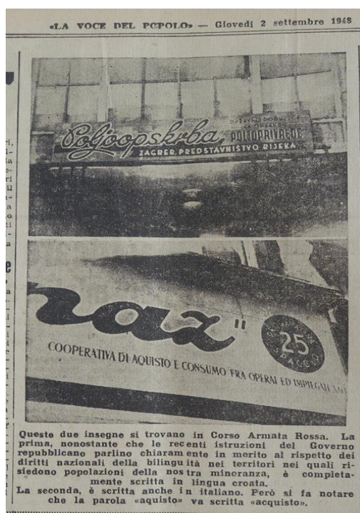
Immagine 4. Bilinguismo a Fiume

Fino al secondo conflitto mondiale, l'Italia sotto il fascismo rendeva obbligatorio a Fiume l'uso esclusivo dell'italiano. A partire dal maggio del 1945, invece, successivamente all'entrata in città delle truppe jugoslave, lo sfondo linguistico di Fiume comincia ad apparire alquanto indefinito. Sui muri della città erano ancora visibili alcuni avanzi delle scritte in italiano del periodo fascista. Contestualmente cominciarono a palesarsi iscrizioni in lingua croata regolanti la nuova vita sociale. Dal 1948 le targhe del centro della città cominciano ad essere bilingui (in croato e italiano); ma, già a partire da un paio di anni più tardi, verso l'inizio degli anni Cinquanta le targhe bilingui cominciano via via a scemare, così come la presenza degli italiani presenti a Fiume.