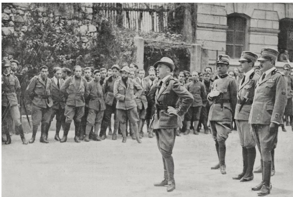
Immagine 1. D'Annunzio a Fiume

D'Annunzio si considera un "superuomo" in virtù delle sue doti di esteta, un uomo raffinato e mondano. Il termine è ripreso da Così parlò Zarathustra di Friedrich Nietzsche, uno dei filosofi preferiti del poeta. Il superuomo è sia un modello di umanità futura che, soprattutto nell'idea dannunziana, il singolo individuo in grado di realizzare pienamente sé stesso, seguendo una propria etica personale, in contrasto con la società 6 .