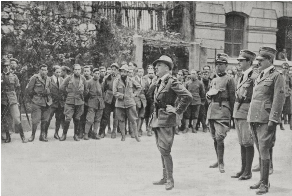
Immagine 1. D'Annunzio a Fiume

D'Annunzio si considera un "superuomo" in virtù delle sue doti di esteta, un uomo raffinato e mondano. Il termine è ripreso da Così parlò Zarathustra di Friedrich Nietzsche, uno dei filosofi preferiti del poeta. Il superuomo è sia un modello di umanità futura che, soprattutto nell'idea dannunziana, il singolo individuo in grado di realizzare pienamente sé stesso, seguendo una propria etica personale, in contrasto con la società 6 .