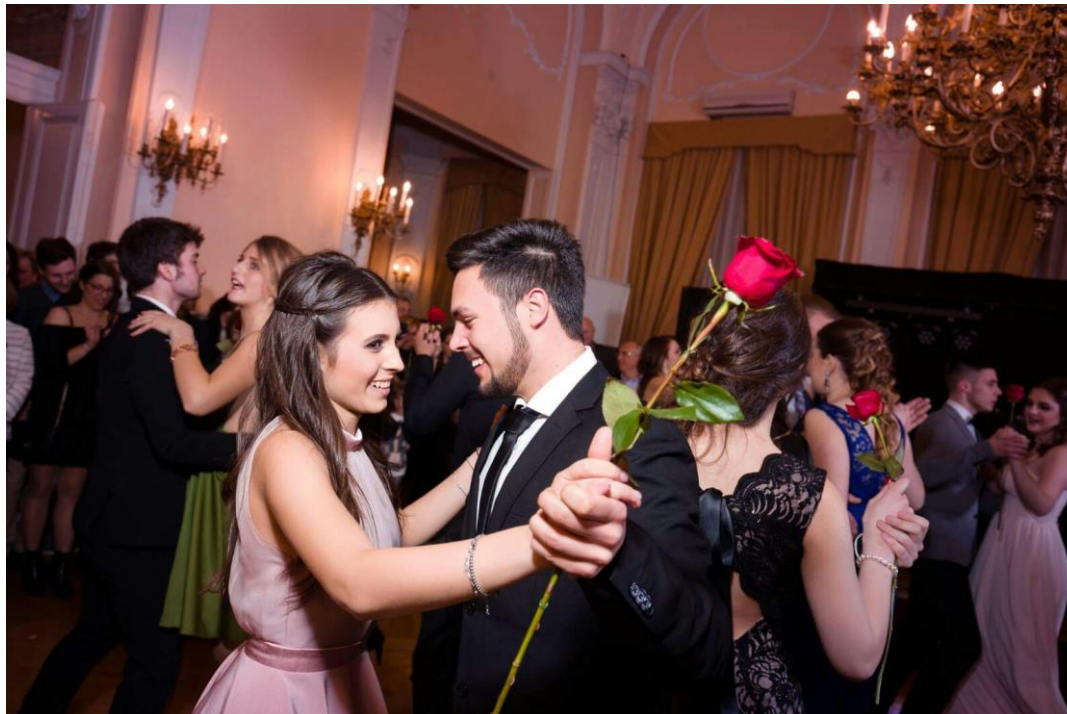
Immagine 6. Ballo di maturità del 2017 in “Circolo”, nella Comunità degli Italiani di Fiume

età attraverso le varie attività scolastiche ed extrascolastiche che essa offre. È comune che gli alunni delle varie scuole elementari italiane di Fiume, si riuniscano al “Circolo” per alcune attività di gruppo, come ad esempio la preparazione di una recita per i genitori, giochi di gruppo, la visione di un film oppure di uno spettacolo, attività corali ecc. Gli studenti della Scuola media superiore italiana, presso il “Circolo” partecipano a delle conferenze, interviste e presentazioni varie, frequentano gli spazi della Comunità adattate allo svago come la sala del biliardo, la biblioteca, giocando a freccette, sfidandosi a ping-pong, usando la sala computer, giocando alla Playstation ed altro. Ogni anno, dopo le ferie invernali, gli studenti delle scuole superiori frequentano maggiormente il “Circolo”, soprattutto per prepararsi ai frequentatissimi balli di maturità. Questi balli, organizzati uno ogni venerdì del mese di gennaio per ciascun indirizzo scolastico (per un totale di 3 oppure 4 balli), danno vita e mettono a buon uso gli spazi del “Circolo”. Il salone delle feste, le varie stanze circostanti, i corridoi ed il bar vengono adoperati dagli studenti, le loro famiglie e amici, dai professori e dai vari membri della Comunità e dell’Unione italiana per celebrare l’evento in centinaia. La festa, accompagnata puntualmente da una band, avvicina e fa conoscere soprattutto ai cittadini fiumani, non appartenenti alla Comunità, gli spazi e la funzionalità della stessa.