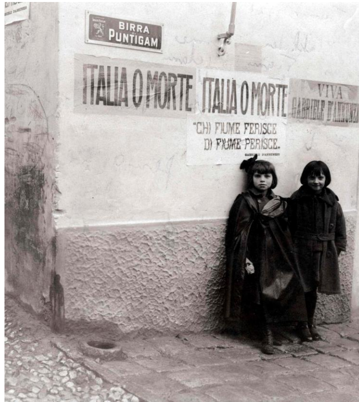
Immagine 2. Italia o morte, Fiume

Il motto ricorrente di quel periodo fu " Italia o morte " dicitura rivendicata non solo dai legionari sul tricolore Fiumano, ma anche dallo stesso poeta durante uno dei suoi discorsi per smuovere l'impassibilità degli italiani dinanzi la questione di Fiume, antecedentemente alla Marcia di Ronchi.