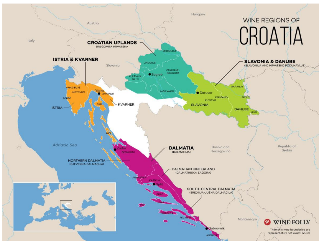
Slika 2. Vinske regije Republike Hrvatske