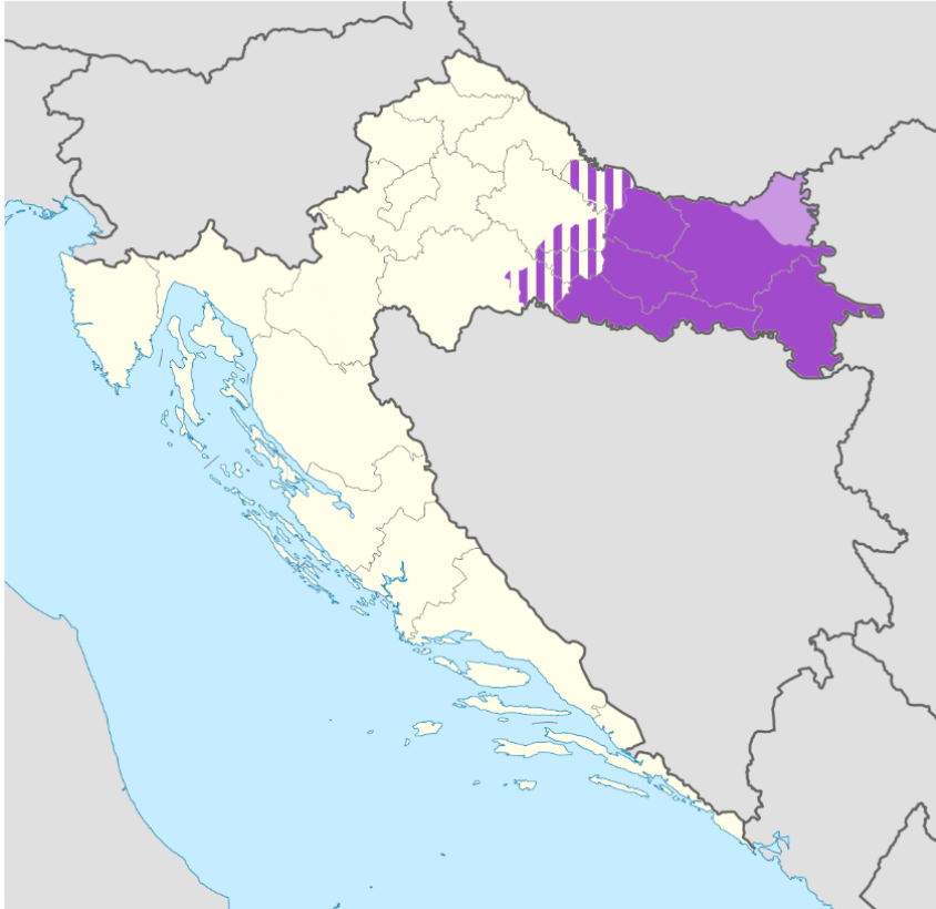
Slika 1. Položaj Slavonije i Baranje

Na slici 1. je prikazan položaj Slavonije i Baranje.