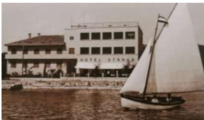
Slika 5. Hotel Strnad

Uz kupalište Češke kolonije, 1937. godine dovršen je hotel Strnad koji je bio najveći hotel u Malinskoj s kapacitetom od 100 postelja i ponudom češke i domaće kuhinje. Do kraja 2008. godine, ovi objekti bili su jedini objekti stranog kapitala. Hotel Strnad izgorio je na dan oslobođenja Malinske 17. travnja 1945. godine, a 1960. godine je obnovljen i ujedno je prvi temeljno obnovljeni hotel na otoku Krku, koji se danas djeluje pod imenom Maestral . 28