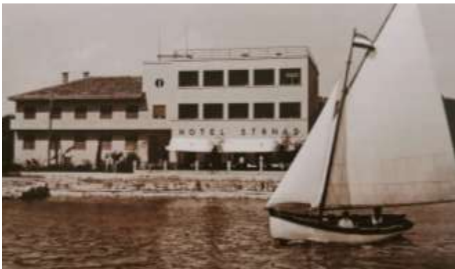
Slika 5. Hotel Strnad

Uz kupalište Češke kolonije, 1937. godine dovršen je hotel Strnad koji je bio najveći hotel u Malinskoj s kapacitetom od 100 postelja i ponudom češke i domaće kuhinje. Do kraja 2008. godine, ovi objekti bili su jedini objekti stranog kapitala. Hotel Strnad izgorio je na dan oslobođenja Malinske 17. travnja 1945. godine, a 1960. godine je obnovljen i ujedno je prvi temeljno obnovljeni hotel na otoku Krku, koji se danas djeluje pod imenom Maestral . 28