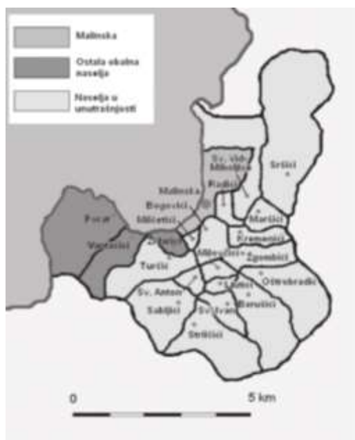
Slika 3. Naselja Općine Malinska - Dubašnica