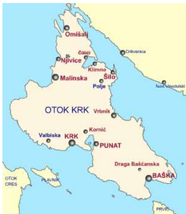
Slika 1. Položaj Općine Malinska – Dubašnica

Općina Malinska – Dubašnica smjestila se na sjeverozapadnom dijelu otoka Krka koji je po svojoj površini drugi najveći otok u Hrvatskoj. Površina otoka Krka iznosi 405,78 km 2 i nalazi se u grupaciji kvarnerskih otoka, smješten između Istre i Velebita, dok s južne strane zatvara Riječki zaljev. Općinu čine dvadesetak raštrkanih sela, koja se pružaju od obalnog do unutrašnjeg dijela otoka i podijeljena su u tri skupine – Dolinjska sela, Gorinjska sela i Poganka. Okružena je Općinom Omišalj na sjeveru, Općinom Dobrinj na zapadu, na istoku je Grad Krk, dok je na zapadnoj strani otvorena prema moru i ima pogled prema Kvarnerskom zaljevu i Gradu Rijeci. Nalazi se približno u sredini otoka, relativno niske i pristupačne obale pa također ima pogled na Istru i Učku sa zapadnog područja. Geografski položaj Općine je 45,13° sjeverne zemljopisne širine i 14,53° istočne zemljopisne dužine.