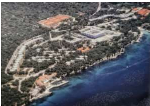
Slika 6. Hotelski kompleks Haludovo