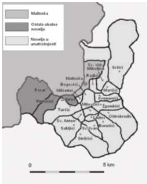
Slika 3. Naselja Općine Malinska - Dubašnica