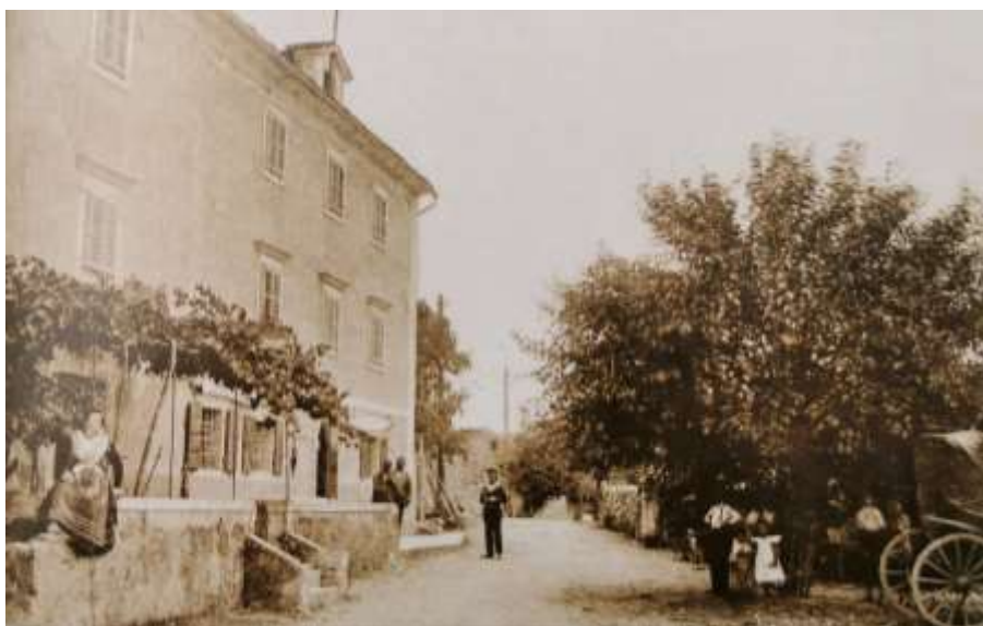
Slika 4. Prvi smještajno – ugostiteljski objekt Al cacciatore

Malinskoj su se prvi turistički objekti gradili domaćim kapitalom. Prvi smještano – ugostiteljski objekt otvoren je 1880. godine po nazivom Al cacciatore , što u prijevodu na talijanskom znači „K lovcu“. Ime je dobio pod utjecajem talijanskog sloja u tadašnjoj austrijskoj Istri i na Kvarnerskim otocima. Služio je kao prenočište i gostionica sa šest, a potom deset soba, u kojoj su dolazili prvi gosti, odnosno bogati lovci. Nakon odlaska talijanskog stanovništva, mijenja ime u Triglav , te postaje hotel 1921. godine. Danas je hotel u privatnom vlasništvu pod imenom Adria , te posluje samo u ljetnim mjesecima. 24