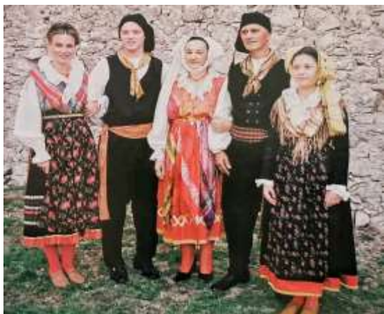
Slika 7. Dubašljanska narodna nošnja

mjestu na otoku. Isto tako, Dubašljanski folklor nastupa tijekom sezone za turiste nekoliko puta i predstavlja pravi hodajući etnografski muzej. 40