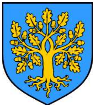
Slika 2. Grb Općine Malinska – Dubašnica

Nakon što su „Lloydovi parobrodi počeli pristajati 1866. godine“ 3 , Malinska se počinje razvijati i pojavljuje se turizam kao nova gospodarska grana. Prostor Općine Malinska – Dubašnica proteže se na površini od 76,68 km 2 s okolicom, a osnovni simbol u grbu je dub odnosno hrast. Dan obilježavanja Općine je 20. srpnja, odnosno dan Svetog Apolinara, sveca dubašljanske župe koji odabran 1997. godine kao zaštitnik mjesta. 4