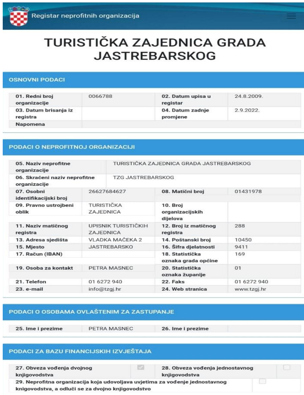
Slika1. Osnovni podatci o TZGJ iz RNO