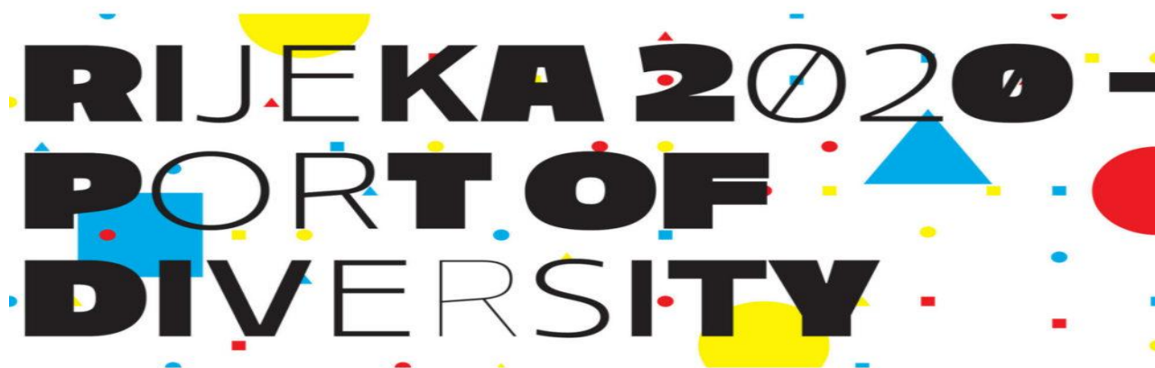
Slika 1. – logo Rijeke za EPK „Luka različitosti“ (rijeka2020.eu)

Rijeci je 24. ožujka 2016. godine dodijeljena prestižna titula Europske prijestolnice kulture 2020. za program „Luka različitosti“, čiji je cilj stvoriti grad kulture i kreativnosti za Europu i budućnost. Proces selekcije trajao je gotovo dvije godine i odvijao se putem Ministarstva kulture.