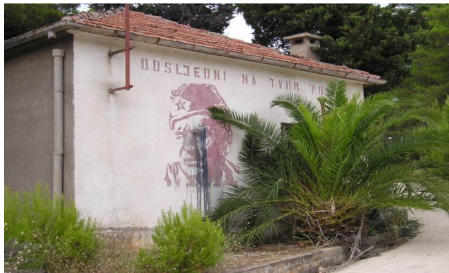
Slika 6. Napuštena zgrada u vojarni “Maršal Tito”

Kasarna “Maršal Tito” (Maršalka) je izgrađena iznad mjesta Uble u borovoj šumi 1970-ih. Prihvatni kapacitet je bio za oko 200 vojnika, a kasarna je sadržavala ambulantu, kompleks zgrada za stanovanje, streljane za vojnu obuku te radionicu za servis automobila, kamiona i vojna vozila. Također, nalazili su se odbojkaški i teniski tereni za rekreaciju, a u neposrednoj blizini se nalazio svinjac kojega su održavali vojnici u svrhu prehrambene opskrbe. 16