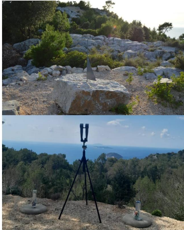
Slika 15. Prikaz instalacije sunčanog sata i originalnog vojnog periskopa