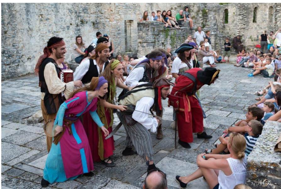
Slika 1. Kostimi korišteni za storytelling

Tokom realizacije nastoji se što više uključiti različite dionike iz turizma, zainteresiranu javnost kao što su lokalne zajednice, studenti, OPG-ovi, glumci, glazbenici i ostali, kako bi se stvorio uspješan turistički proizvod ili turistički paket. Vrijednosti koje projekt želi posebno naglasiti čine kvaliteta, originalnost, inovativnost i održivost te ih žele preslikati i na svoje partnere s kojima surađuju. U samu glumu su uključeni obrazovani glumci, žongleri i plesači koji sa pomno biranim i izrađenim kostimima kojima se pridaje velika pažnja prikazuju uzbudljive i zanimljive priče iz povijesti te su prikladni kako za mlađe tako i za starije, domaće i strane goste.