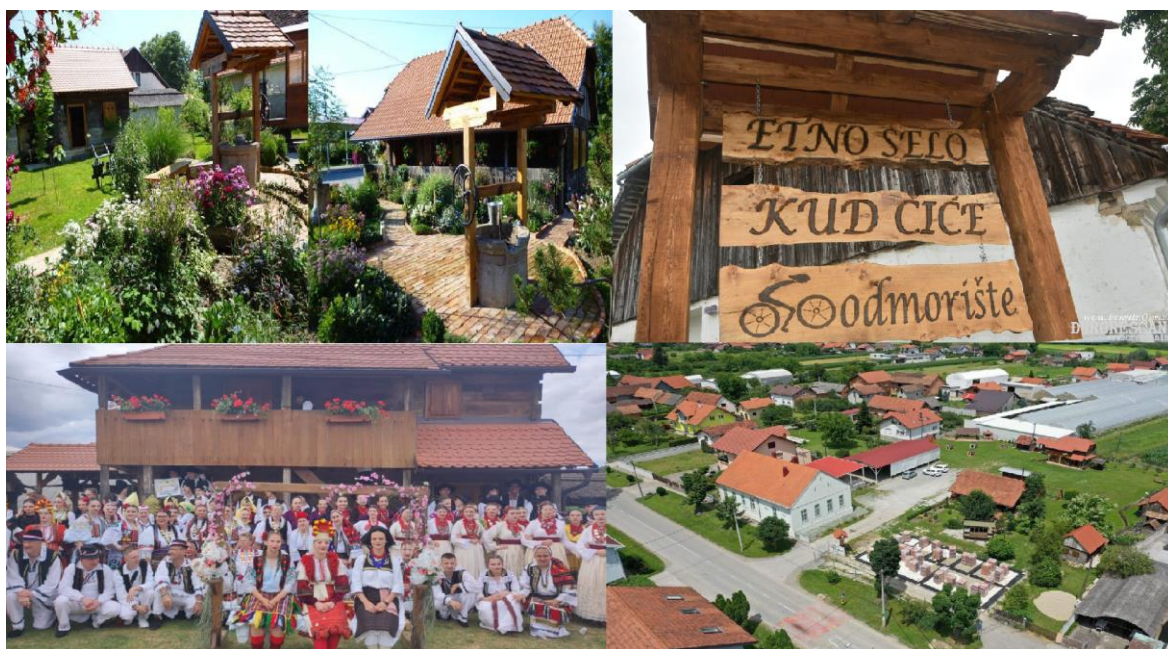
Slika 2. Položaj i običaji sela Novo Čiče