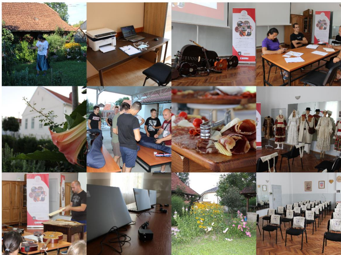
Slika 3. Provedba projektnih aktivnosti u Društvenom centru Novo Čiče