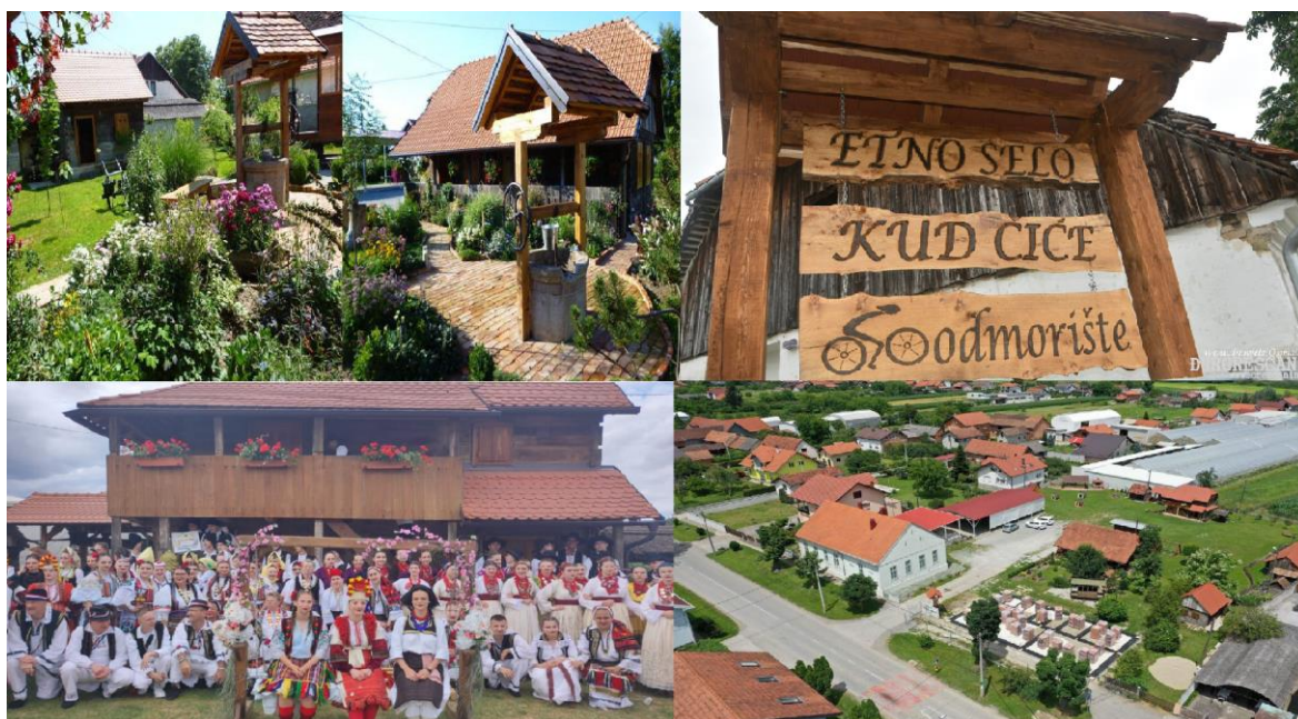
Slika 2. Položaj i običaji sela Novo Čiče