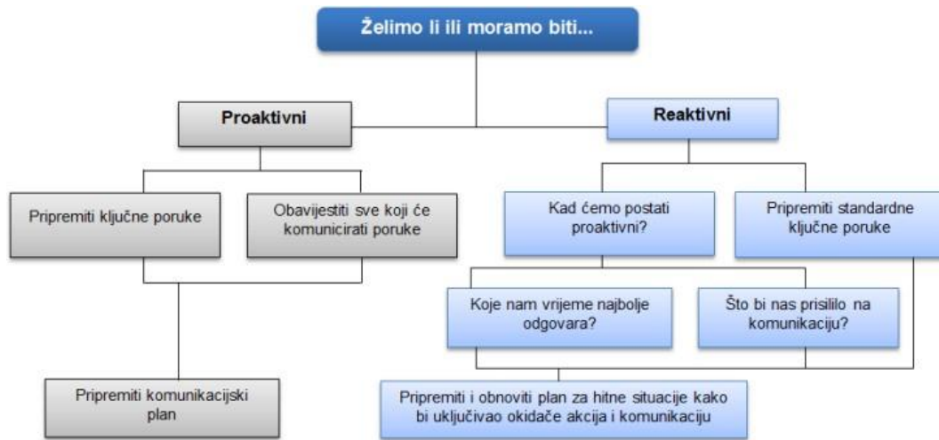
Shema 1. Komunikacija u kriznoj situaciji