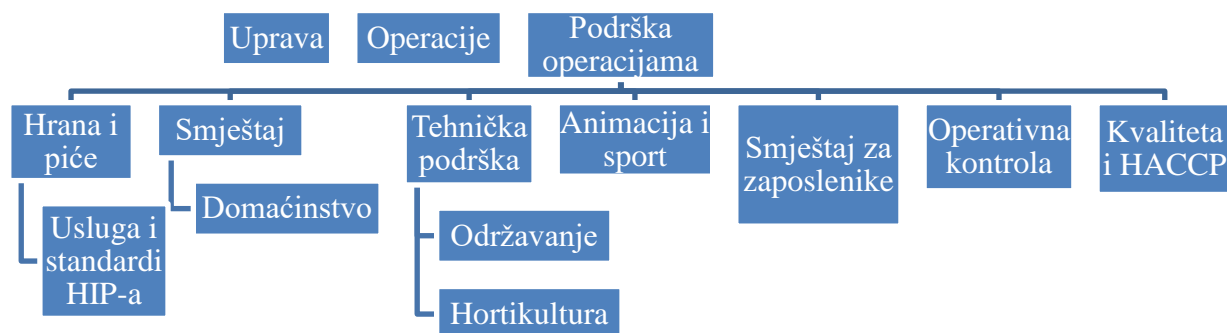
Shema 2. Organizacijska struktura u objektima Maistre d.d.