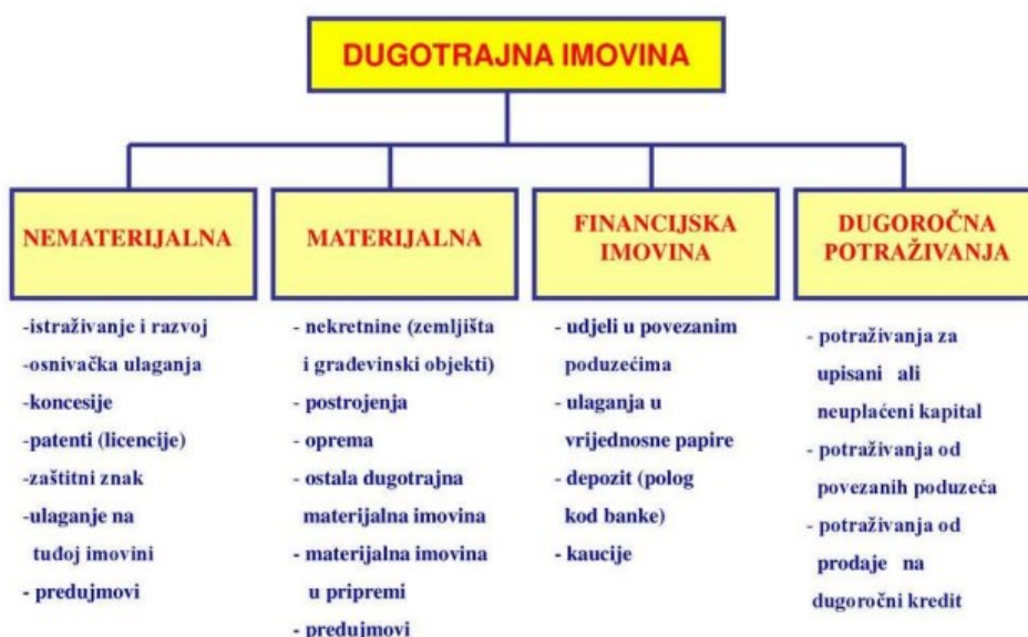
Slika 2: Klasifikacija dugotrajne imovine

Dugotrajna imovina je ona imovina koja ima vijek trajanja duži od jedne godine i obično traje nekoliko godina. Dugotrajna imovina smatra se manje likvidnom, što znači da se ne može lako pretvoriti u gotovinu.