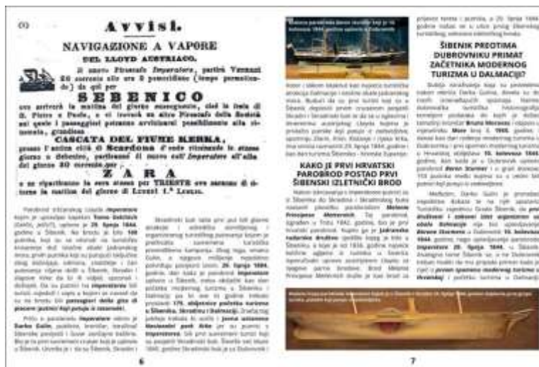
Slika 3: Članak iz VOLIM ŠIBENIK, broj 33. 25