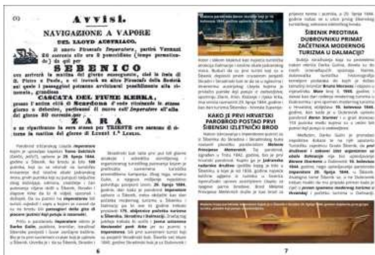
Slika 3: Članak iz VOLIM ŠIBENIK, broj 33. 25