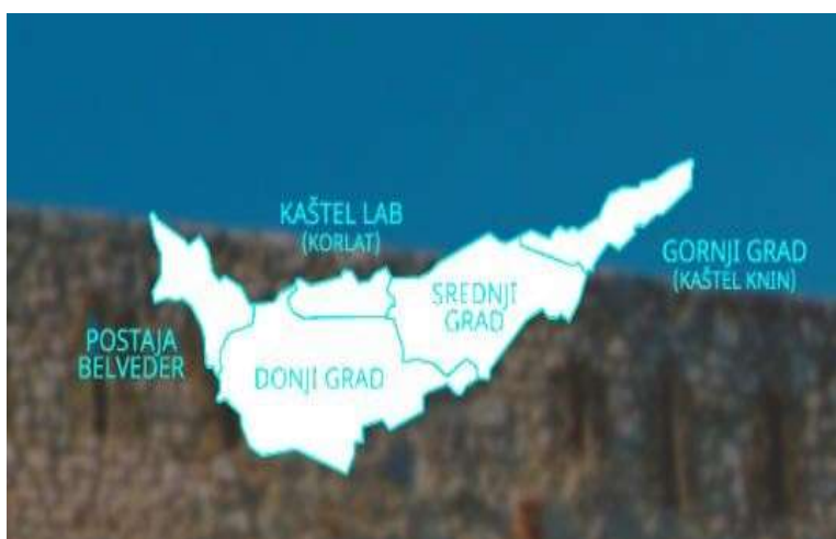
Slika 8: Podjela Kninske tvrđave 68

Kninska tvrđava zaštićena je urbanistička cjelina i upisana je u registar Kulturne baštine Republike Hrvatske, kao i spomenik nulte kulture, tj. spomenik od posebnog nacionalnog interesa. 67