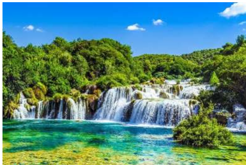
Slika 9. Nacionalni park Krka 80

Nacionalni park Krka namijenjen je prije svega kao znanstveno, kulturno, odgojno-obrazovno i rekreativno odredište za posjetitelje, ali je isto tako i glavna turistička destinacija. To potvrđuje činjenica da kroz Park svake godine prođe gotovo milijun posjetitelja.