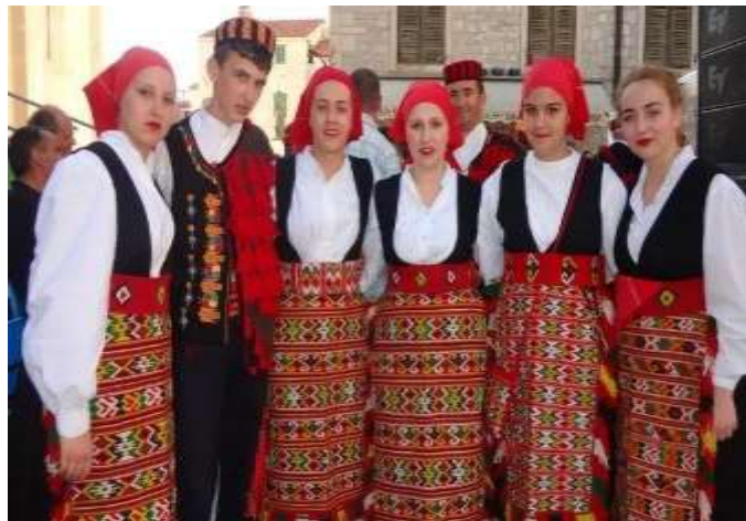
Slika 5: Narodne nošnje u Šibeniku 54

Sva ova kulturna bogatstva čine Šibenik i okolicu privlačnom destinacijom za posjetitelje koji žele istražiti bogatu povijest i kulturu ovog područja.