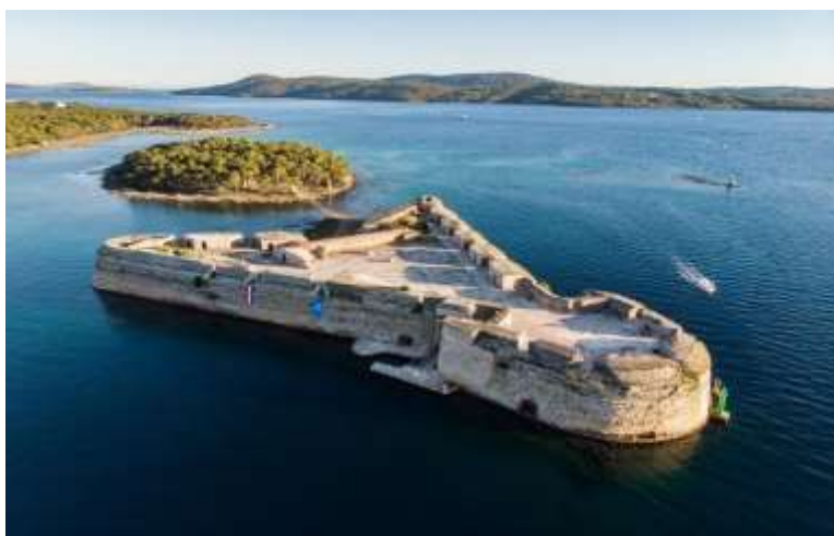
Slika 7. Tvrđava sv. Nikole 65

Kroz projekt Turističke valorizacije Šibensko-kninske županije 2013. godine, uređena je šetnica u kanalu svetog Ante i pristupni put do tvrđave. Tvrđava je 2017. godine uvrštena na UNESCO-vu listu svjetske kulturne baštine, a 2019. godine službeno je otvorena preuređena tvrđava u sklopu projekta financiranog sredstvima Europske unije, Šibensko-kninske županije i Vlade Republike Hrvatske, odnosno Ministarstvom kulture