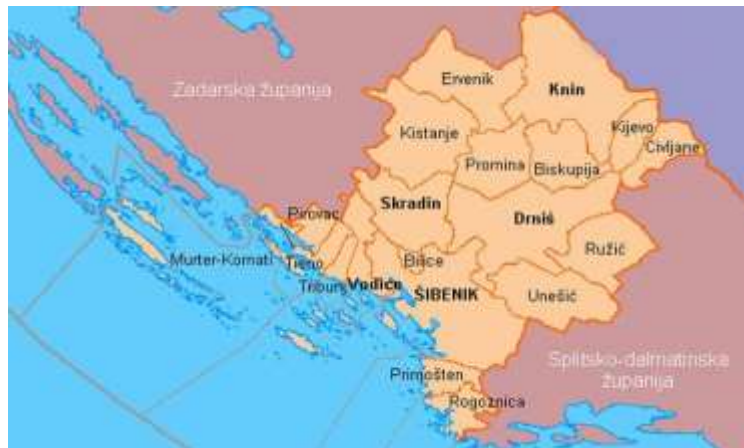
Slika 4: Karta Šibensko-kninske županije 29

Županija je administrativni, politički, gospodarski, društveni i kulturni centar koji se proteže duž obale oko sto kilometara, dok se zaleđe šire prema podnožju Dinare, udaljenom oko 45 kilometara.