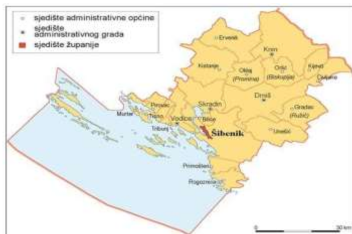
Slika1: Opća geografska karta Šibensko-kninske županije 3

Rad sadrži uvod, osam poglavlja i zaključak. Prvo poglavlje bavi pojašnjenjem pojma turizma te prikazuje turizam u globalnom i nacionalnom kontekstu. Drugo poglavlje donosi općenite informacije o Šibensko-kninskoj županiji, uključujući smještaj, reljef, stanovništvo, klimu, prometnu povezanost, gospodarstvo i povijesni razvoj. Treće poglavlje detaljno opisuje glavna turistička odredišta županije, dok se četvrto bavi kulturnim spomenicima. Peto poglavlje istražuje prirodnu baštinu regije. U šestom poglavlju su predstavljene manifestacije koje se održavaju u županiji, dok se sedmo poglavlje fokusira na nautički turizam. Konačno, osmo poglavlje ističe razvojne ciljeve Šibensko-kninske županije.