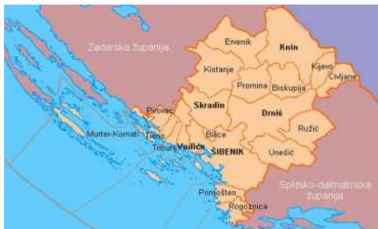
Slika 4: Karta Šibensko-kninske županije 29

Županija je administrativni, politički, gospodarski, društveni i kulturni centar koji se proteže duž obale oko sto kilometara, dok se zaleđe šire prema podnožju Dinare, udaljenom oko 45 kilometara.