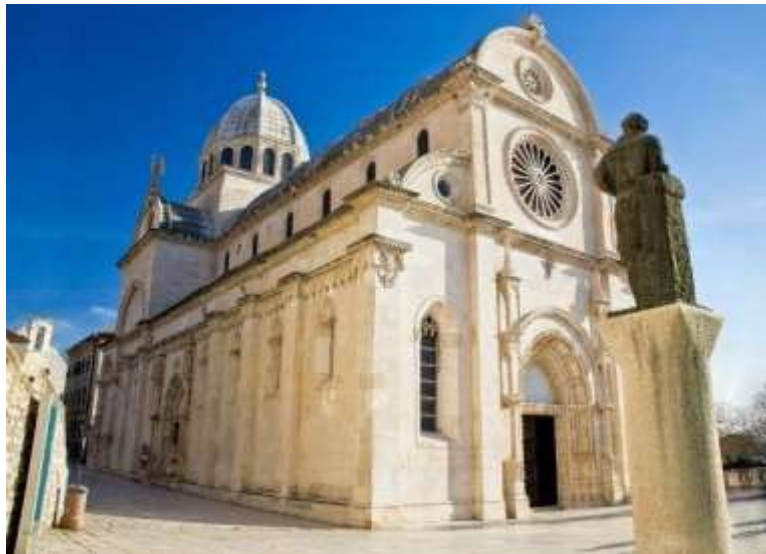
Slika 6. Katedrala sv. Jakova 57