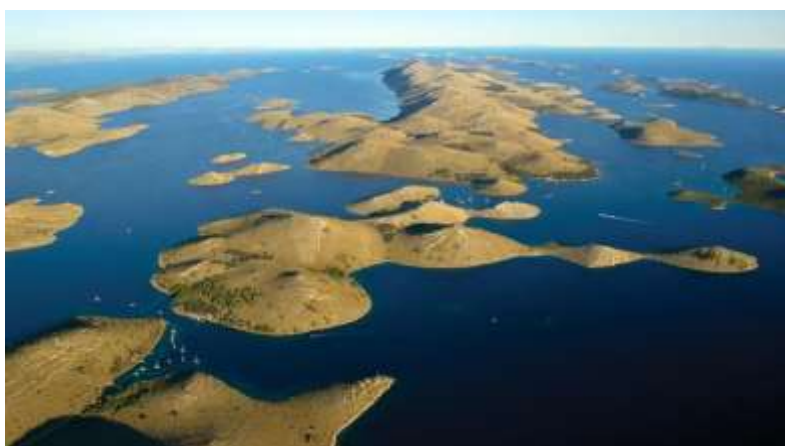
Slika 10. Nacionalni park Kornati 83

Najviše strme litice s kojih se pruža prekrasan pogled na pučinu nalaze se na otoku Klobučaru (visine 80 metara), Rašipu Velikom (visine 64 metra) i Piškerima (visine 45 metara), dok podmorski grebeni uranjaju u more i dosežu dubine od devedeset metara 82 . Na otoku Piškerima nalazi se pet kuća i mala crkva, izgrađena 1560. godine isključivo za ribare, što je jedinstven primjer takve crkve na Jadranu. Otoci su uglavnom bez vegetacije, prekriveni samo rijetkom travom, negdje planikom i crnikom, dok je podmorje bogato ribom. Trenutno se koristi u turizmu kao Nacionalni park koji privlači posjetitelje zbog svoje nevjerojatne ljepote, raznovrsnosti krajolika te mogućnosti za aktivnosti poput plovidbe, ronjenja i istraživanja netaknute prirode. Neiskorišteni potencijal ovog arhipelaga može biti daljnji razvoj održivih oblika turizma koji promiču zaštitu prirode i očuvanje biološke raznolikosti, kao i organizacija ekoloških edukativnih programa koji posjetiteljima pružaju uvid u krhki ekosustav ovog područja.