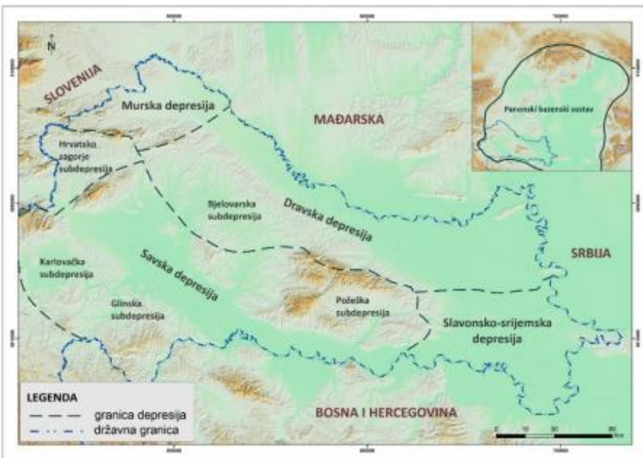
Slika 2. Depresije Hrvatskog dijela Panonskog bazena.