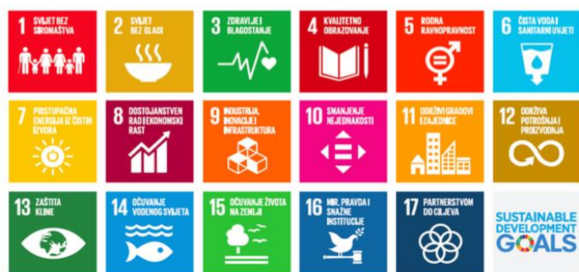
Slika 2. Sedamnaest ciljeva održivog razvoja

Sedamnaest globalnih ciljeva za održivi razvoj, poznatih i kao Globalni ciljevi, predstavljaju nove, univerzalne ciljeve i pokazatelje koje države članice Ujedinjenih naroda trebaju primjenjivati u razvoju svojih programa i politika tijekom sljedećih petnaest godina. 19