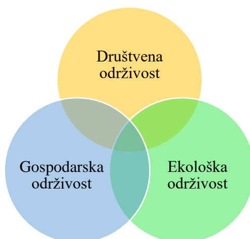
Slika 1. Tri glavna područja održivosti