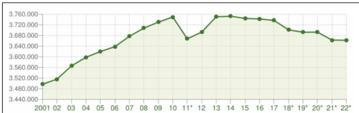
Slika 2. Prikaz demografskih kretanja regije Toscana

gospodarsku aktivnost, što se odrazilo i na demografske trendove u Toscani. Populacija Toscare u 2021. godini iznosila je 3.663.191 stanovnika, što predstavlja pad od 29.674 u odnosu na prethodnu godinu (Slika 2). 13