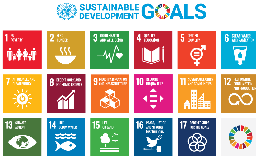
Slika 2 - 17 ciljeva održivog razvoja