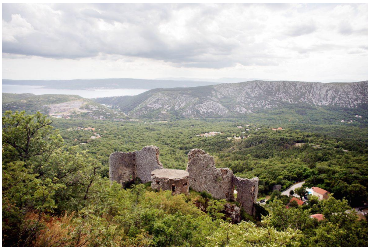
Slika 11 Kaštel Grižane