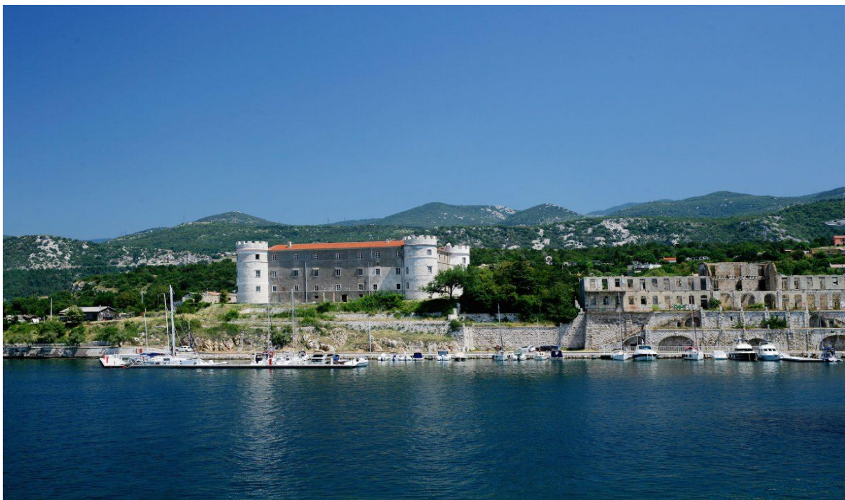
Slika 7 Dvorac Nova Kraljevica