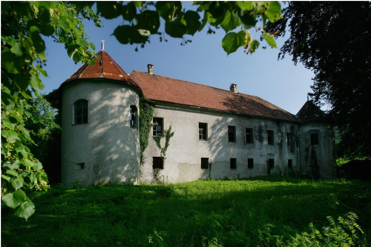
Slika 18 Dvorac Severin