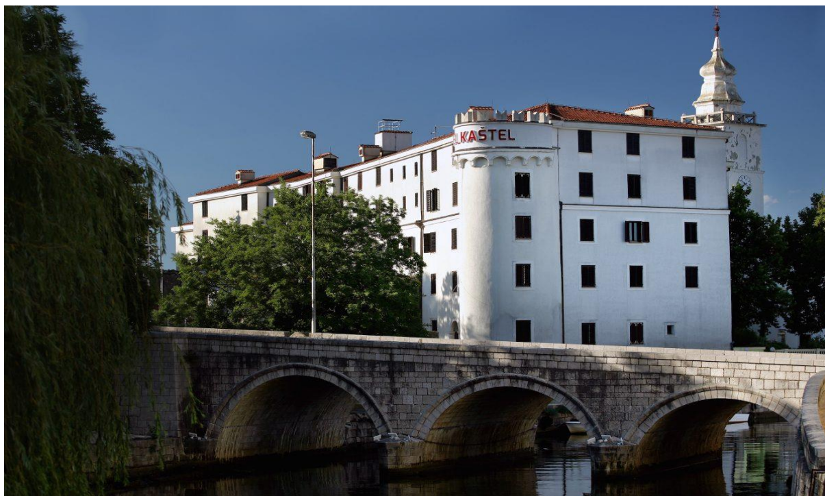
Slika 12 Hotel „Kaštel“