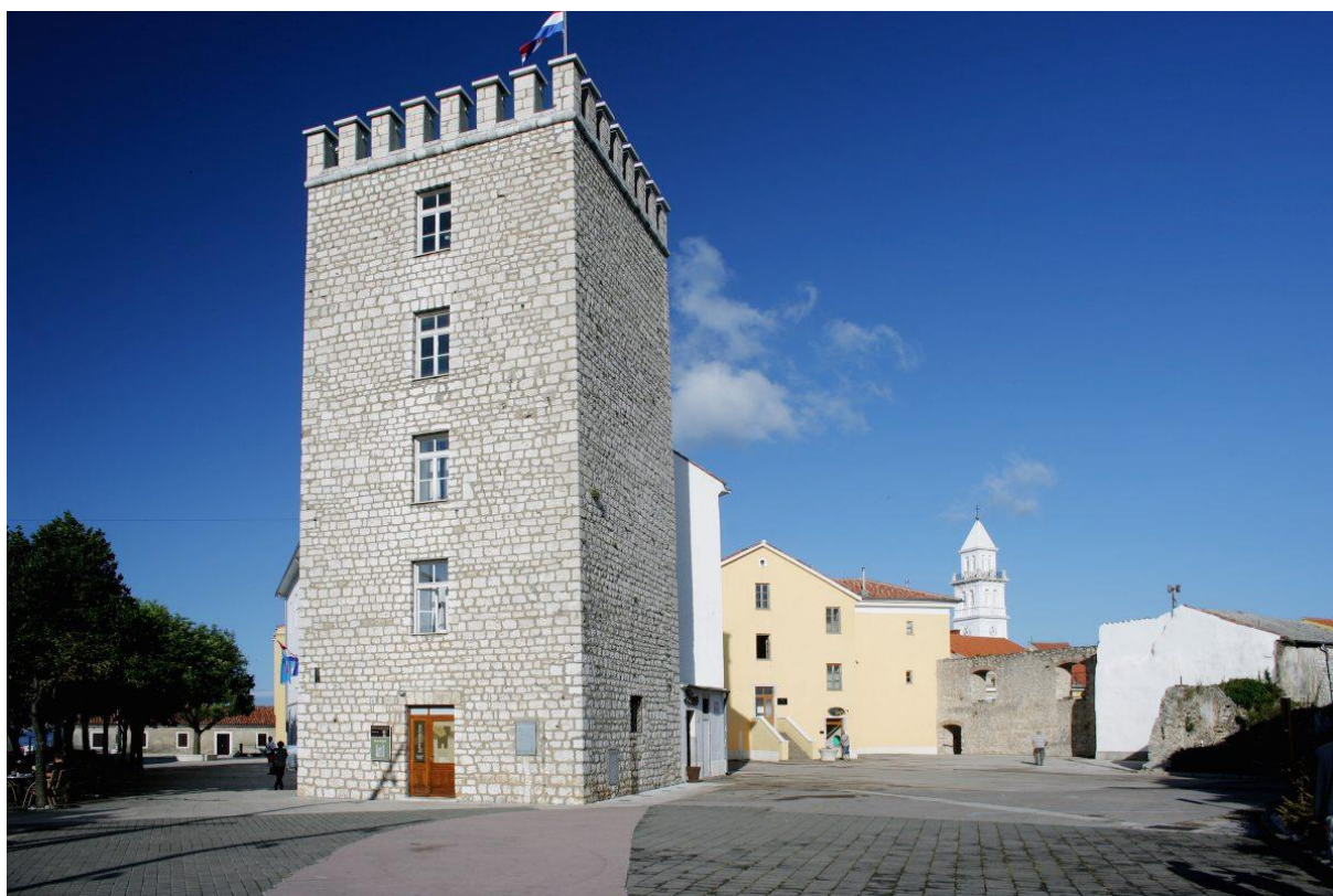
Slika 14 Kvadrac