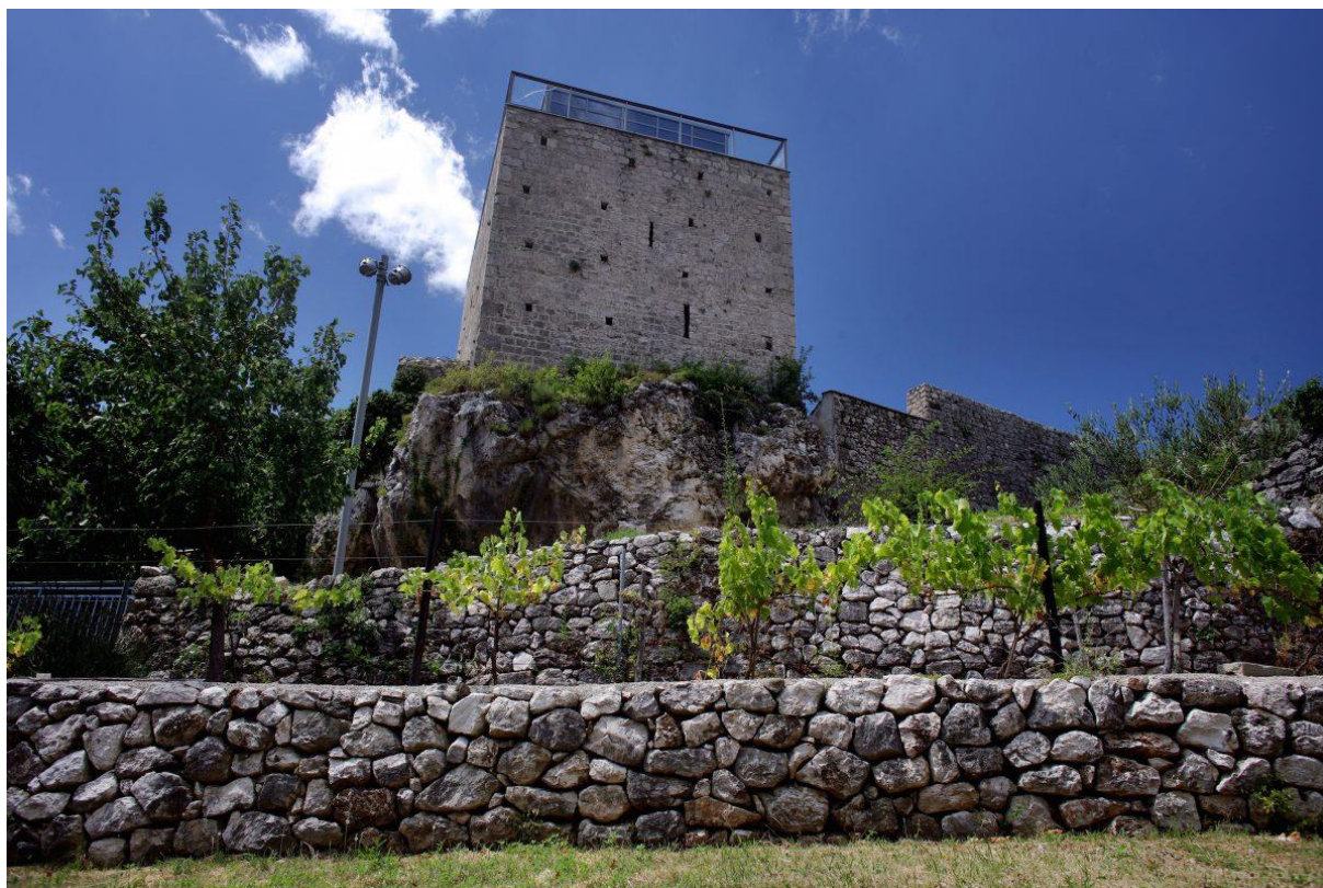
Slika 13 Kula u Bribiru