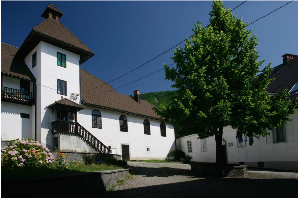
Slika 16 Dvorac Zrinski