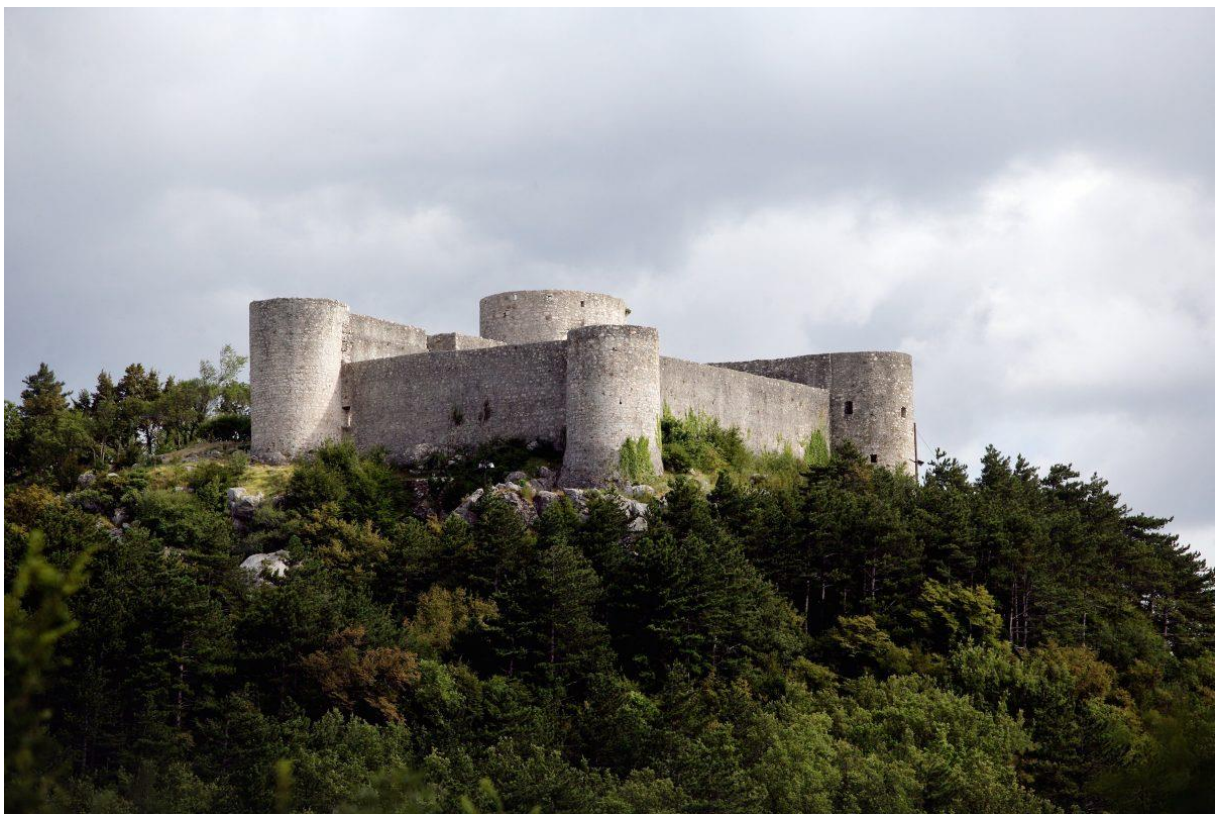
Slika 10 Kaštel Drivenik