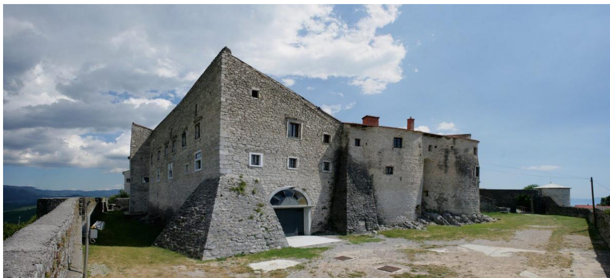
Slika 4 Kaštel Grobnik