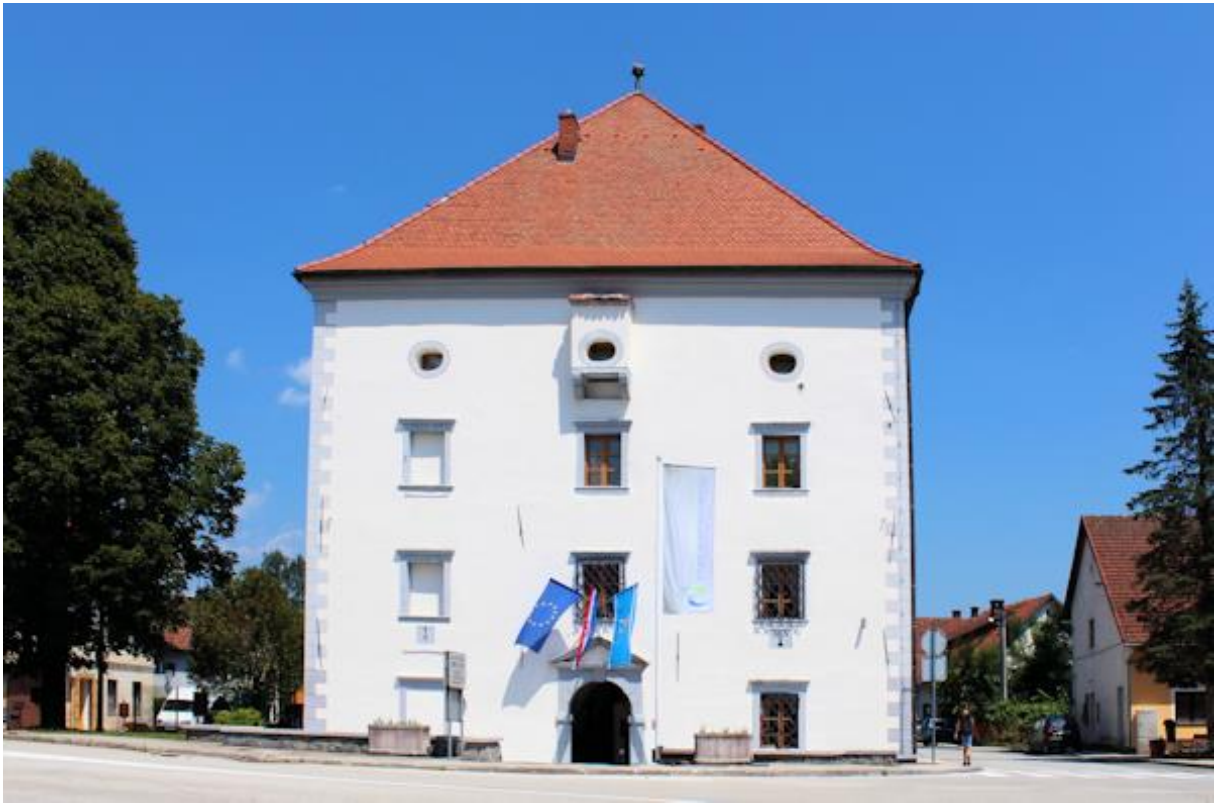
Slika 17 Kaštel Zrinskih