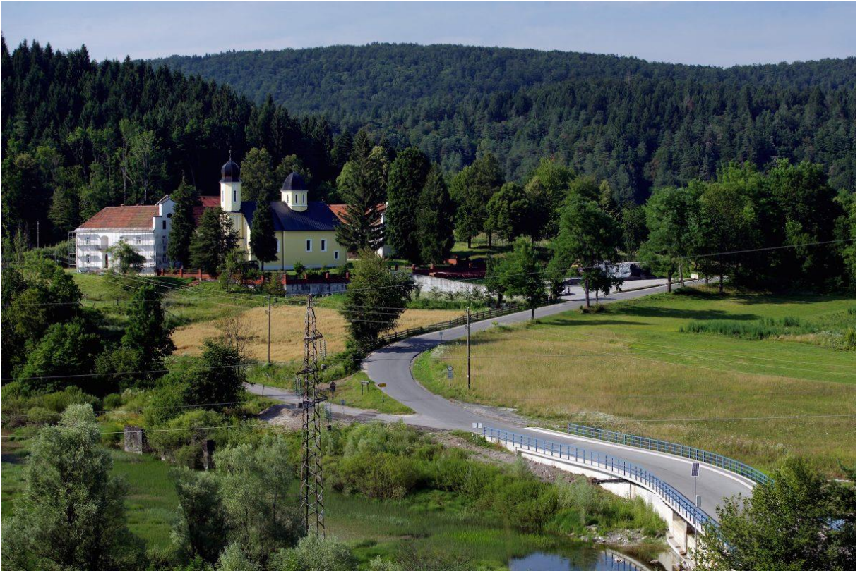
Slika 20 Manastir Gomirje