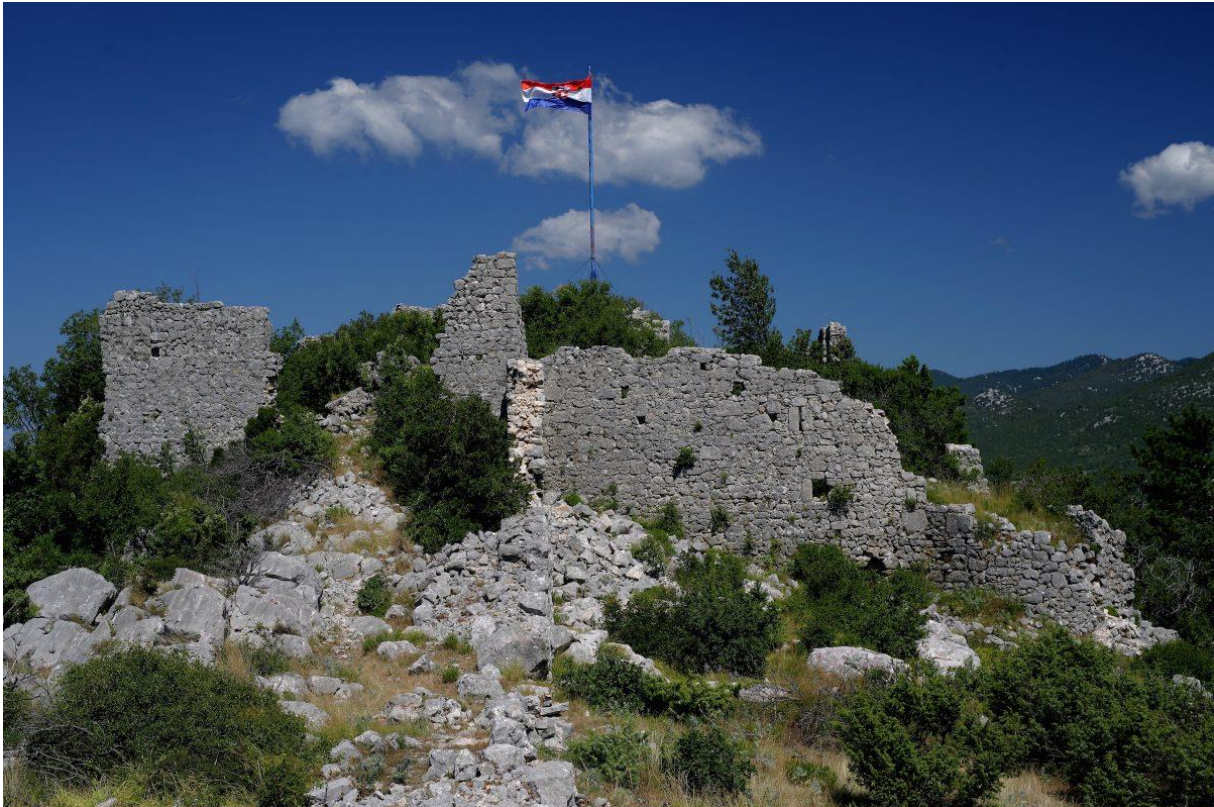
Slika 15 Stari grad Ledenice