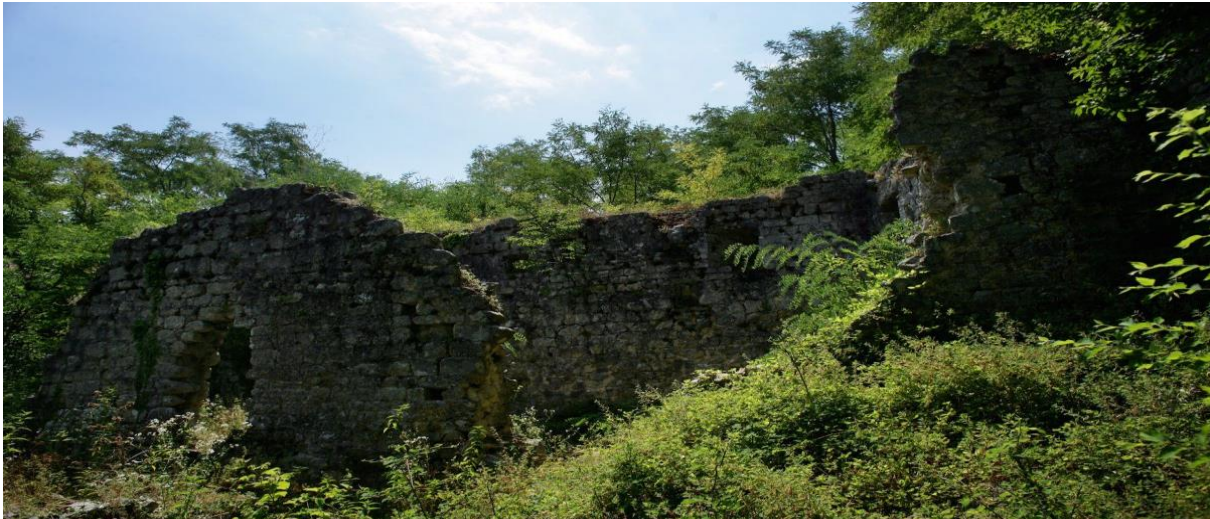
Slika 1 Kaštel Gradec