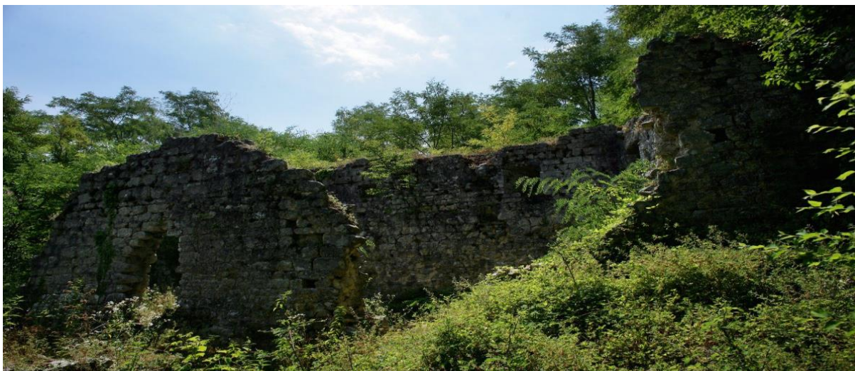
Slika 1 Kaštel Gradec