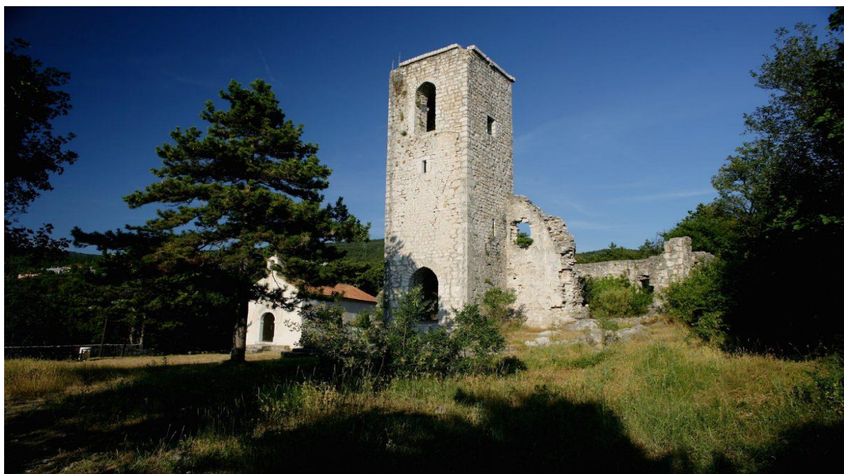
Slika 8 Stari grad Hreljin