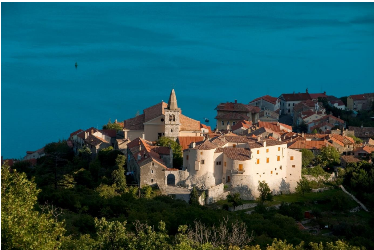
Slika 6 Kaštel u Bakru