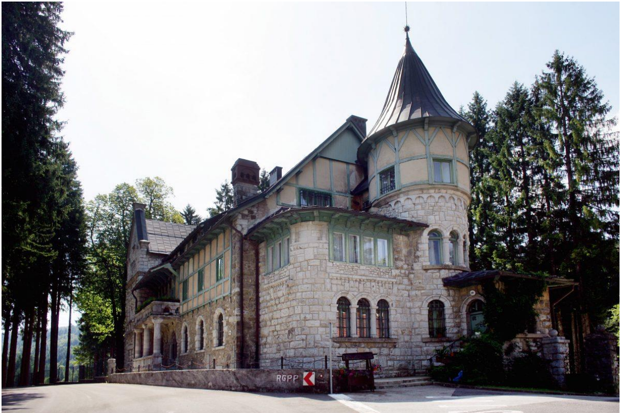
Slika 19 Dvorac Stara Sušica