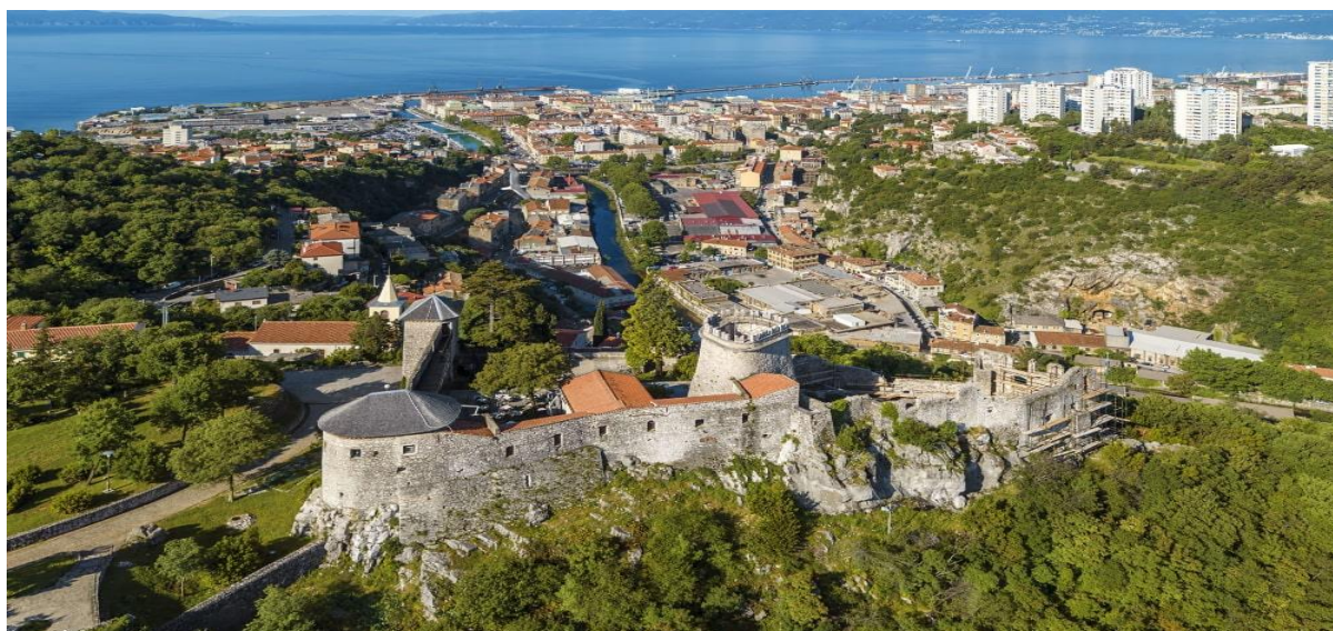
Slika 5 Kaštel Trsat