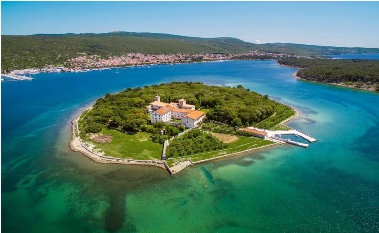
Slika 3 Franjevački samostan s crkvom Navještenja Marijina - otočić Košljun