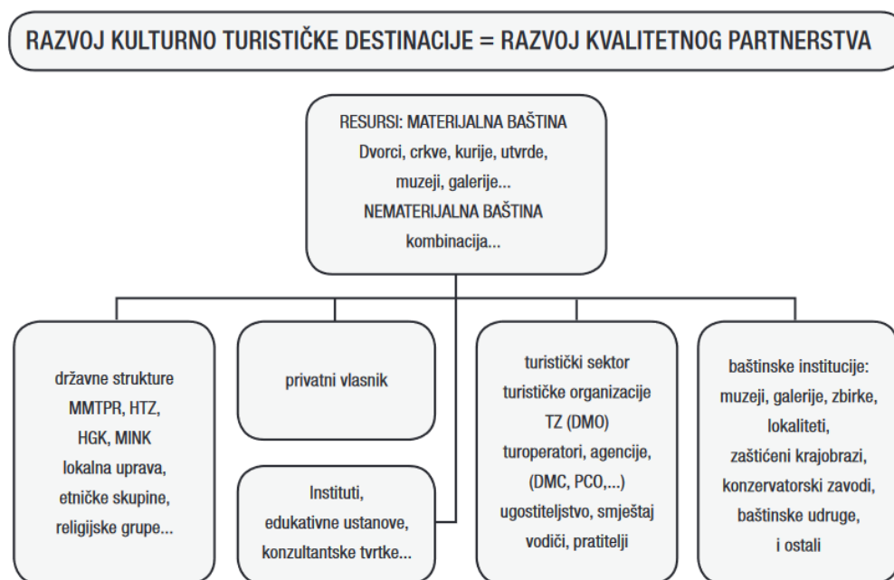
Shema 1 Razvoj kulturno - turističke destinacije