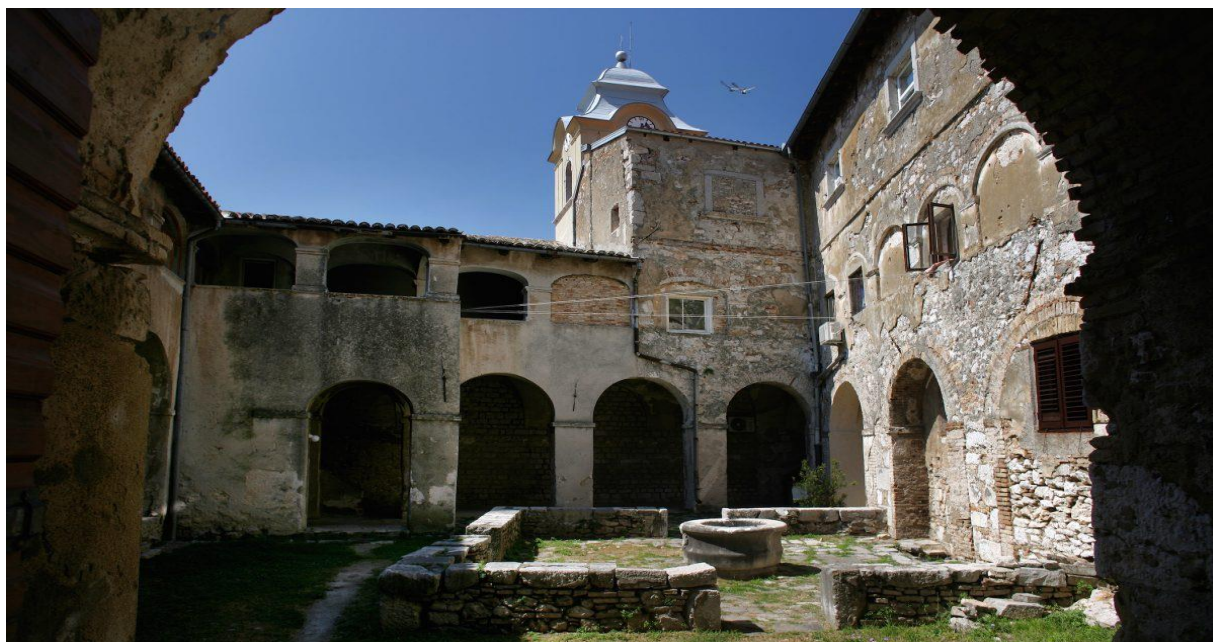
Slika 9 Stari grad Zrinski