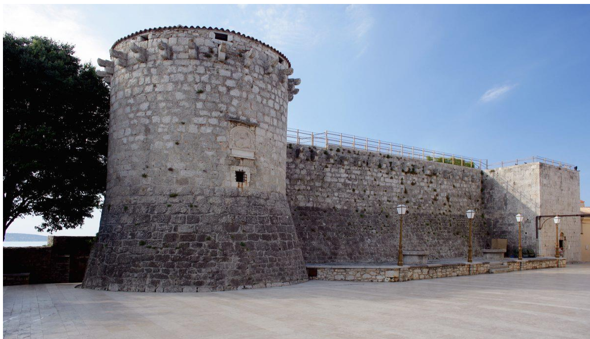
Slika 2 Kaštel u Krku