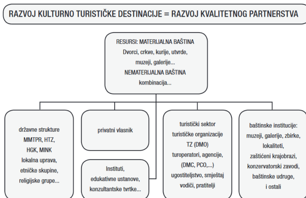
Shema 1 Razvoj kulturno - turističke destinacije

Izvor: Klarić, „Put prema održivome kulturnom turizmu Hrvatske“, str. 36