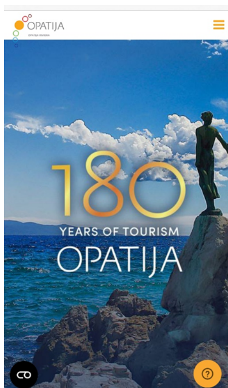
Slika 9 Optimizirana mobilna verzija web stranice Visit Opatija

Izvor: https://www.visitopatija.com/hr preuzeto: 15.05.2024.)