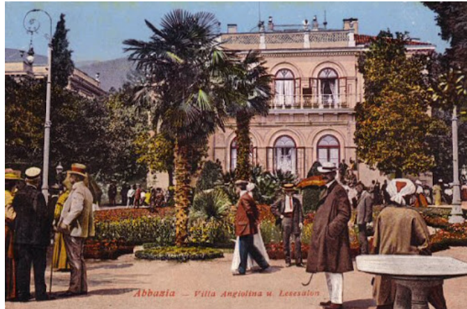
Slika 1 Villa Angiolina