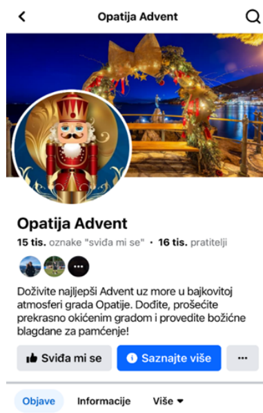
Slika 7 Facebook stranica Visit Opatija