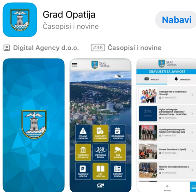
Slika 10 Mobilna aplikacija Grad Opatija