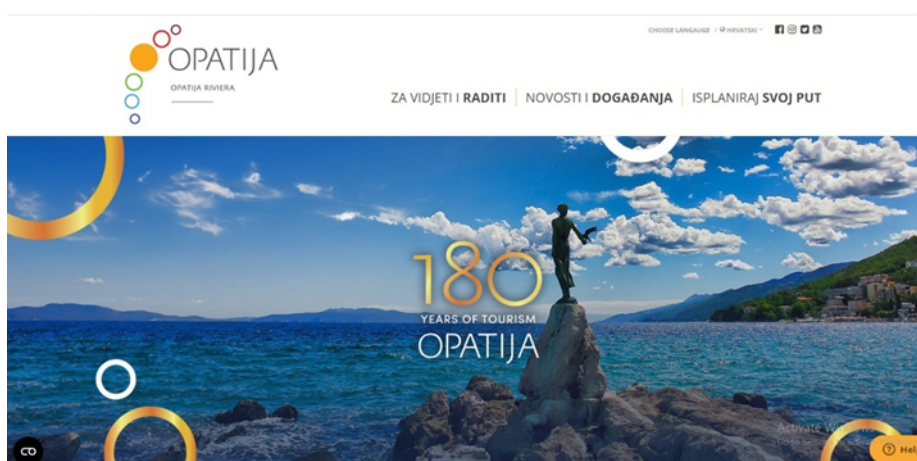
Slika 6 Web stranica Visit Opatija

Izvor: https://www.visitopatija.com/hr , preuzeto: 15.05.2024.