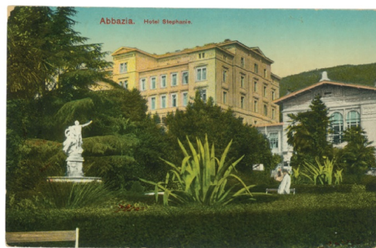
Slika 3 Hotel Stephanie