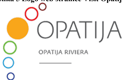
Slika 5 Logo web stranice Visit Opatija