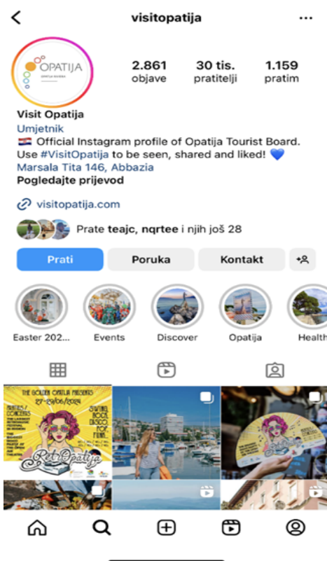
Slika 8 Instagram stranica Visit Opatija