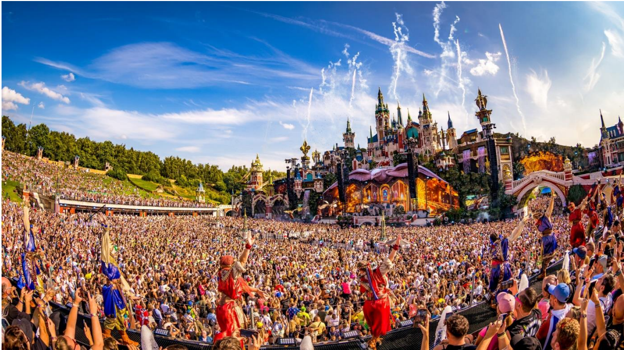
Slika 1. Tomorrowland