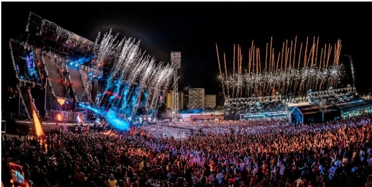
Slika 3. Ultra Europe Split