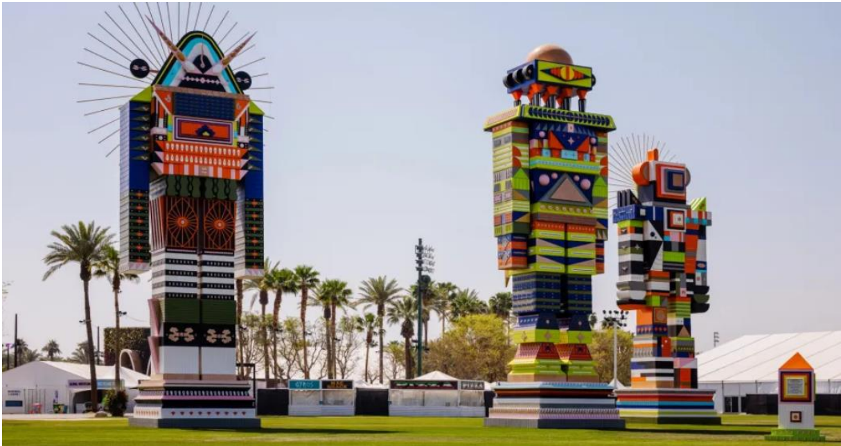
Slika 2. Coachella - 2023., spektakularne instalacije na festivalu