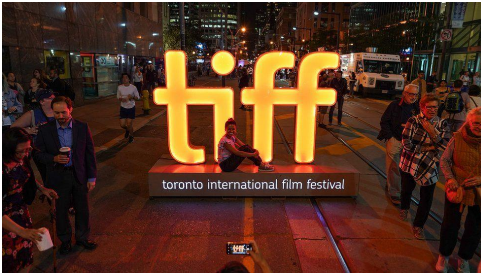
Slika 5. Međunarodni filmski festival u Torontu (TIFF)