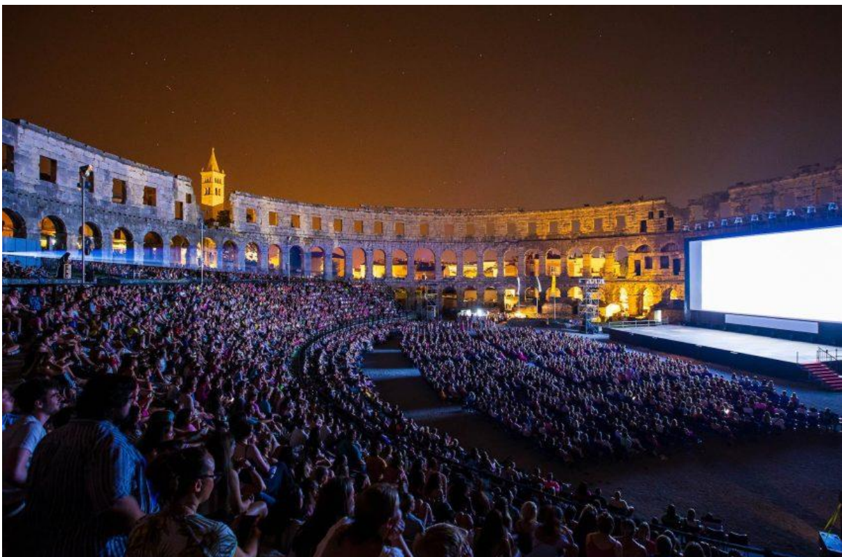
Slika 6. Filmski festival u Puli