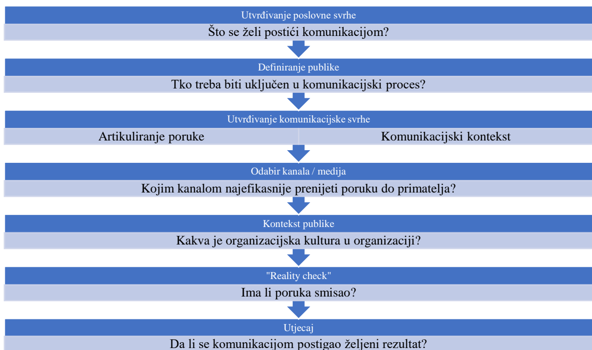
Slika 2 Proces interne komunikacije u organizaciji