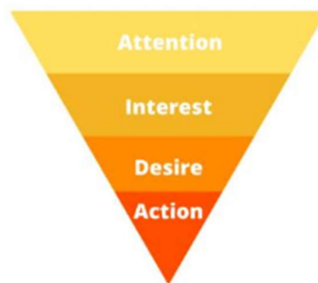
Slika 2. AIDA model kroz prodajni lijevak

Model koji je fokusiran na proučavanje učinkovitosti oglašavanja kako bi uspjeli privući pozornost ciljne skupine te stvoriti interes, želje i akcije zove se AIDA model ( A – Attention, I – interest, D – Desire, A – Action ).