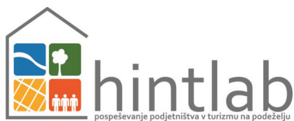
Slika 3: Brend projekta HINT LAB - promicanja poduzetništva u turizmu u ruralnim područjima Hrvatske i Slovenije

Za ilustraciju naglasaka na identitetu i grafičkim rješenjima ruralnog turizma obiju država predstavljamo i aktualne vizualne identitete brendova koji promiču ruralni turizam, odnosno posebice ruralno područje i turizam u Sloveniji i u Hrvatskoj (Slika 4).