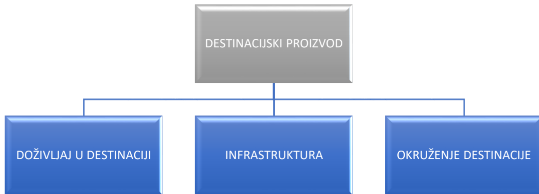
Slika 1: Konceptualni model destinacijskog proizvoda

Izrada autora prema: Murphy, Pritchard i Smith (2000, u Magaš, Vodeb i Zadel, „Menadžment turističke organizacije i destinacije“, 2018, 36)