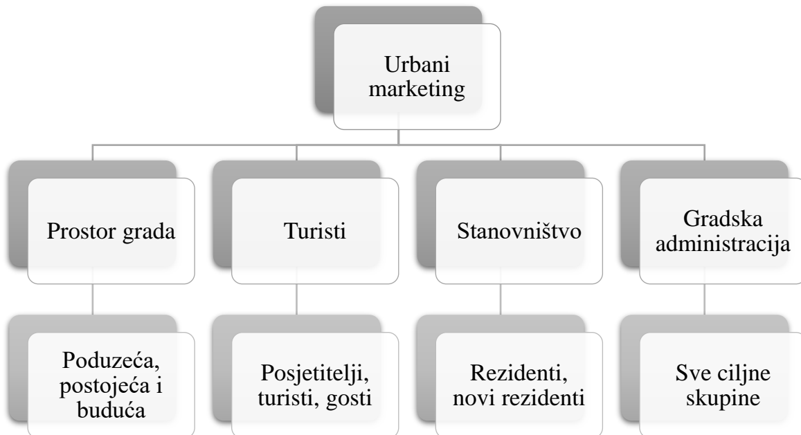
Slika 3: Obuhvat urbanog marketinga

pažnju usmjeri na građane koji su u ulozi klijenata grada i gradske proizvode, odnosno usluge grada koje uključuju razne socijalne, komunalne i druge usluge kao servis građanima. Navedeno uključuje i drugačiji pristup gradske birokracije. Na slici koja slijedi prikazan je obuhvat urbanog marketinga.