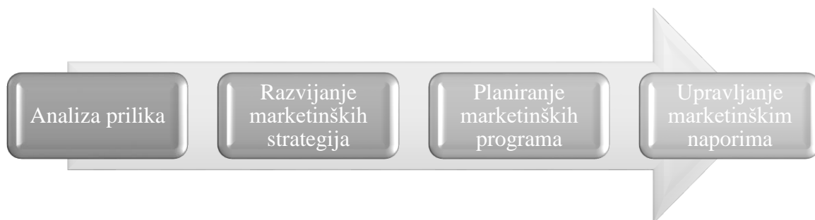
Slika 2: Marketinški proces

te određivanje njihovih cijena promocije i distribucije kako bi se obavila razmjena koja zadovoljava ciljeve pojedinaca i organizacija“ (Paliaga, 2004, 8). Kotler, (1972, u Križman Pavlović, Živolić, 2008, 101), smatra kako je marketing moguće tipizirati s aspekta nositelja aktivnosti, proizvoda ili ciljnog tržišta. Marketinški proces sastoji se od slijedećih elemenata, prikazanih na slici koja slijedi: