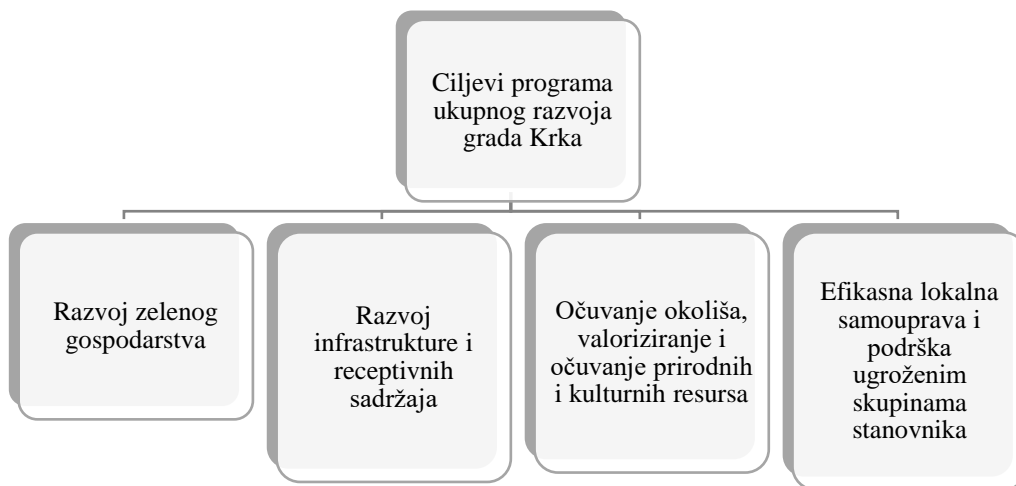
Slika 5: Ciljevi Programa ukupnog razvoja Grada Krka

Ova strategija temelji se na smjernicama razvoja turizma, održivosti i ulaganja u okoliš. U skladu s postavljenim strateškim smjernicama, Grad Krk se pozicionira kao razvijena urbana sredina, u skladu s potrebama turista ali i svog stanovništva, te se temelji na principima održivosti, osobito ekološke. Radi se o strateško-plansko-razvojnom dokumentu koji služi kao sredstvo za učinkovito i uspješno upravljanje razvojem Grada Krka. Na slici koja slijedi, prikazani su strateški ciljevi Programa ukupnog razvoja Grada Krka.