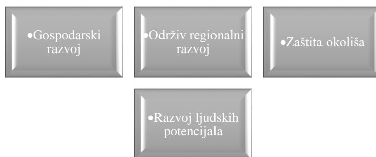
Slika 6: Strateški ciljevi razvoja Grada Mali Lošinj

Ovaj strateški dokument kojim se Grad Mali Lošinj pozicionira kao održiva destinacija, nastao je 2013. godine. Njime je određena i vizija Grada Malog Lošinja: „Održivim razvojem do otoka zdravlja i vitalnosti, za mlade koji ostaju i goste koji se vraćaju“ (PUR, 2013, 72). Ovim se dokumentom vrši analiza postojećeg stanja s naglaskom na prometnu infrastrukturu, gospodarstvo, društvene djelatnosti, zdravstvenu zaštitu, socijalnu skrb, te sport i rekreaciju. Također, PUR-om su postavljeni definirani slijedeći strateški ciljevi kojima Grad Mali Lošinj planira svoj razvoj (PUR, 2013), a prikazani su na slici koja slijedi.