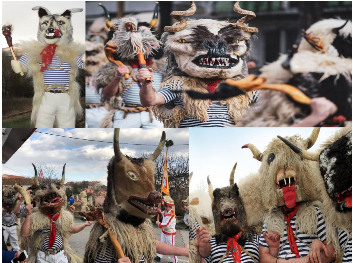
Photographie n° 6 : Masques des sonneurs de cloches Halubaj