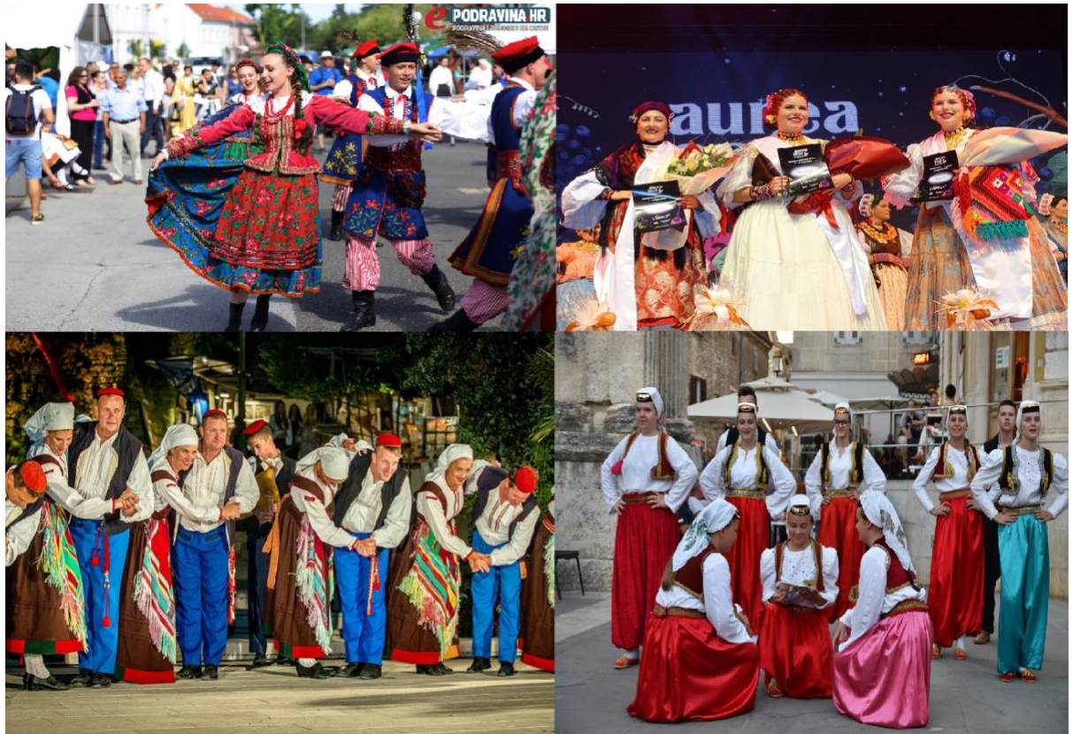
Photographie n° 3 : Festivals en fonction des manifestations culturelles – folklore

de Cannes et de Berlin. La région est connue pour son ambiguïté, son caractère changeant, son caractère éphémère et éphémère. Cependant, d'une manière générale, un « festival » est considéré comme différent des autres programmes culturels en termes d'intensité de la fréquence des événements qui seraient considérés comme non durables tout au long de l'année, en particulier lorsqu'ils se déroulent dans plusieurs lieux (Getz, 2010).