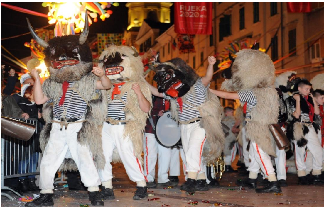
Photographie n°4 : Les sonneurs de cloche d'Halubaj

Les personnes les plus importantes de toute la période du carnaval, tant à Kvarner que dans d'autres parties de la Croatie, sont les sonneurs de cloches, c'est-à-dire les "bergers de la magie du carnaval". Ceux de Kastavština sont particulièrement célèbres, et plus récemment ceux de Grobnik, mieux connus sous le nom de « dondolaši » (Kvarner.hr, 2023). Les sonneurs de cloches de la partie orientale de Kastavština - Halubaja (Viškovo, Marčelji, Zamet) portent des masques d'animaux enveloppés de peau de mouton et trois cloches pendent autour de leur taille.