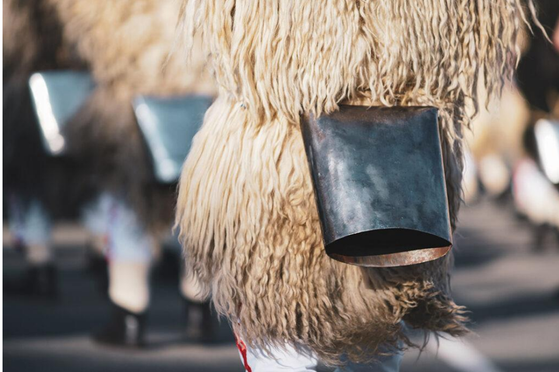
Photographie n° 5 : Cloches traditionnelles des sonneurs de cloches Halubaj