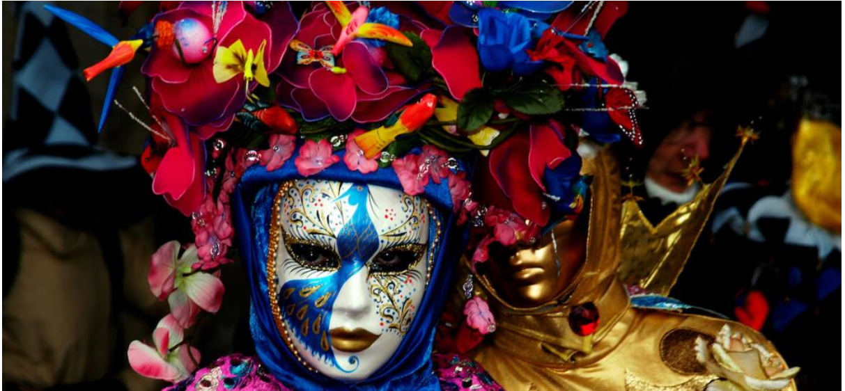
Photographie n°8 : Comparaison des masques vénitiens et d'Halubaj

principalement des usines américaines. Ce concours accélère le déclin de cet artisanat historique caractéristique de la ville de Venise. Plusieurs styles de masques différents sont portés au carnaval de Venise, dont certains ont des noms reconnaissables. Les gens de différentes professions portaient des masques différents.