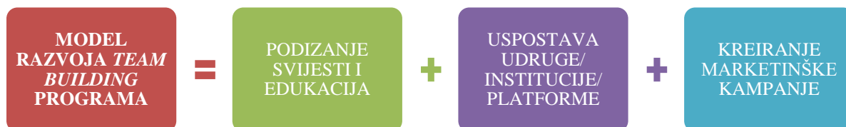
Grafikon 3. Model razvoja team building programa u Istarskoj županiji