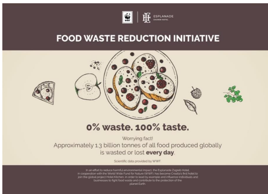
Slika 6. Food Waste reduction initiative