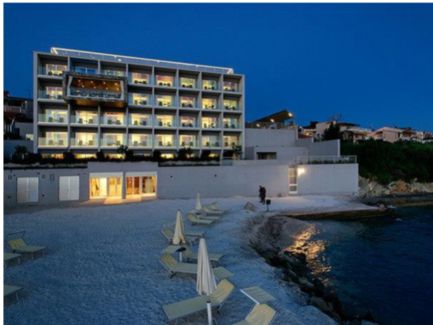
Slika 7. Hotel Split

Hotel Split primjer je boutique hotela koji je građen po načelima zelene gradnje te je u obiteljskom vlasništvu. Namirnice iz domaćeg uzgoja i kontroliranog podrijetla, tradicionalna dalmatinska kuhinja, ali i poznata internacionalna jela je ono čime se posebno ističe restoran 46 . Također, potrošnja energije mu je vrlo niska te ima rezervoare za skupljanje kišnice, kante za recikliranje otpada na svim pogodnim mjestima te educirane zaposlenike.