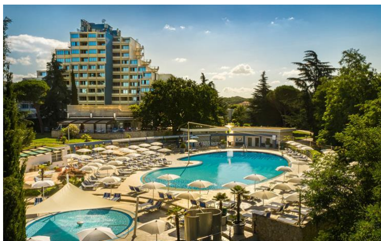
Slika 9. Valamar Diamant Hotel & Residence Poreč

Porečki hotel Valamar Diamant prvi je uveo certifikat Healthy Meal Standard, koji targetira goste sa specifičnim prehrambenim potrebama, navikama i željama, a posebice sportaše koji ovaj hotel često biraju za svoje pripreme. Valamar se odlučio za certifikate za osobe s intolerancijom na gluten, za vegane, vegetarijance, sportaše i za osobe koje žele reducirati i uravnotežiti svoju tjelesnu masu 50 . Također, prema ovom standardu, sva hrana u ponudi mora imati i navedene hranjive vrijednosti, što uključuje energetska vrijednost, masti, ugljikohidrate, bjelančevine, te informacije o alergenima.