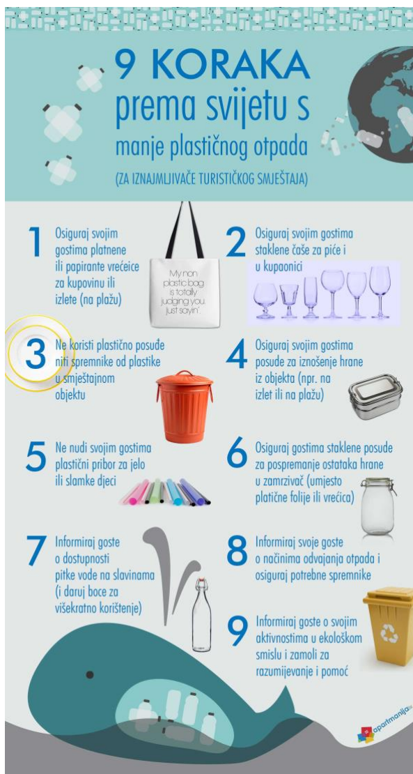
Slika 4. 9 koraka prema svijetu s manje plastičnog otpada.

ugostiteljstvom. Nadalje, uočeno je da u svijetu konstantno rastu površine pod ekološkom poljoprivredom kao i samo tržište ekoloških proizvoda. Međutim, ekološko osviješteni gosti traže ekološki osviještene domaćine. Prema tome, potrebno je obratiti pažnju i na niz drugih čimbenika kod formiranja eko turizma. Jedan od najvećih je smanjenje potrošnje plastike i ostalih štetnih sastojaka za prirodu.