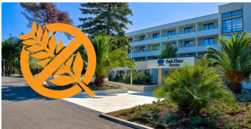
Slika 3. Park Plaza Arena- gluten free certifikat

HACCP sustava, dobroj proizvođačkoj praksi (DPP) i dobroj higijenskoj praksi (DHP). Kao dokaz da je sve navedeno prepoznato i od strane gostiju hotela govori i upravo primljeno prestižno priznanje TripAdvisora - Certificate of Excellence (certifikat izvrsnosti) kojeg je Park Plaza Arena dobio nakon priznanja Travelers' Choice 2017, istog turističkog portala, isključivo na osnovu recenzija gostiju koji su boravili u hotelu 25 .