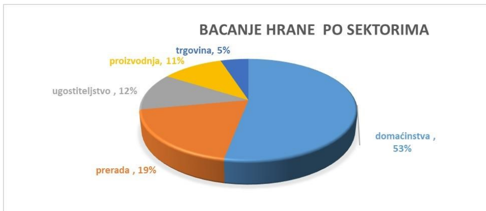
Slika 5. Prekomjerno bacanje hrane

proizvodnji (poljoprivredi, ribarstvu) te ugostiteljstvu i trgovačkom sektoru veleprodaji i maloprodaji 38 . Količina hrane koja se na globalnoj razini baca više je nego dovoljna da nahrani svaku gladnu osobu na planet.