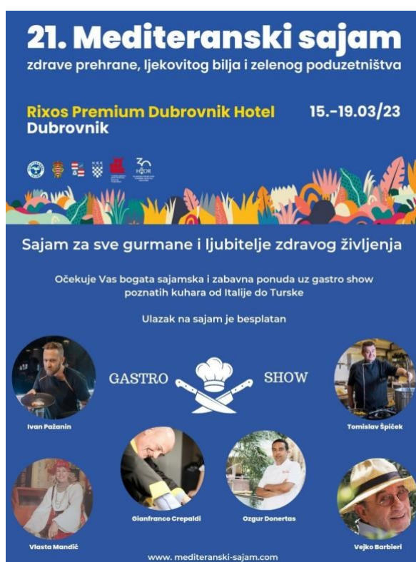
Slika 2. 21. mediteranski sajam

Hoteli također kako bi se promovirali organiziraju razne sajmove i uvode razne certifikate kako bi pokazali ponudu zdrave hrane ali i moderne gastronomije kojom će privući širok spektar gostiju. Jedan od takvih sajmove održava se u hotelu Rixos Premium u Dubrovniku. To je Mediteranski sajam zdrave prehrane, ljekovitog bilja i zelenog poduzetništva. Cilj sajma je postizanje veće razine ekološke svijesti, održivi razvoj, promocija zdrave prehrane, ljekovitog bilja i zelenog poduzetništva, a kroz kvalitetu plasman i marketing 24 . Sajam okuplja ljubitelje zdravog življenja i privlači mnoge gurmane obzirom da u gastro showu sudjeluju poznati kuhari, od Italije do Turske. Mediteranski sjamovi održavaju se i u Hotelu Ivan u Amadria Parku.