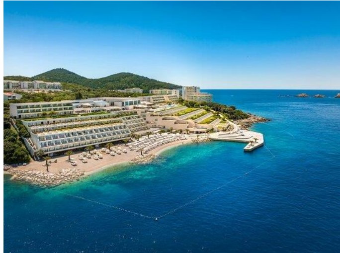
Slika 8. Hotel Valamar President Dubrovnik

Još jedan primjer eko hotela je Valamar. Valamar veliku pozornost poklanja upravo održivom poslovanju, što znači smanjenje potrošnje energije i vode, zbrinjavanje otpada, uštedu resursa te brigu o zaposlenicima i lokalnoj zajednici. Između ostalog, Valamar Riviera je prva u Hrvatskoj uvela certifikat Healthy Meal Standard.