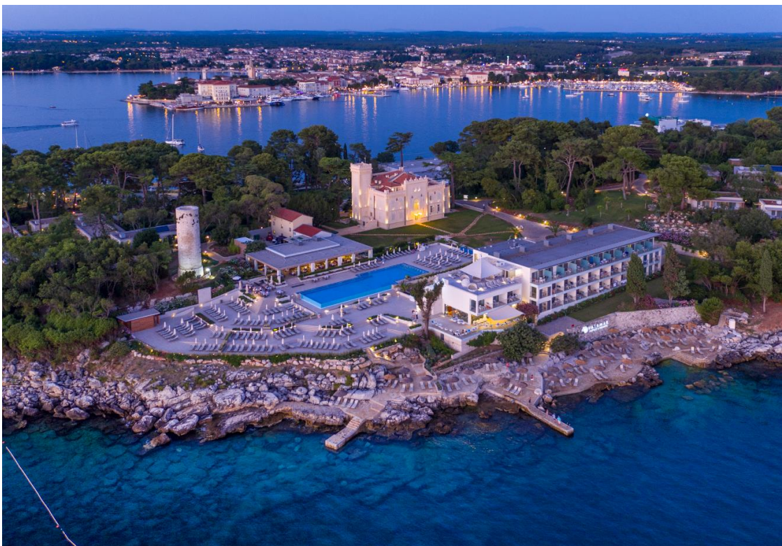
Slika 1. Valamar Isabella Island Resort, Poreč