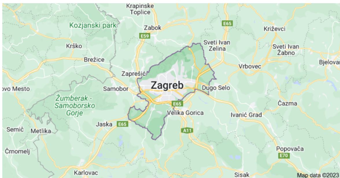
Slika 1. Položaj grada Zagreba i Zagrebačke županije