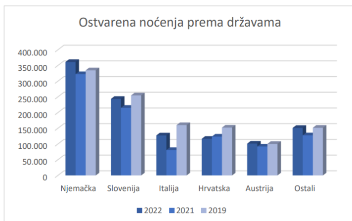
Grafikon 1. Ostvarena noćenja prema državama