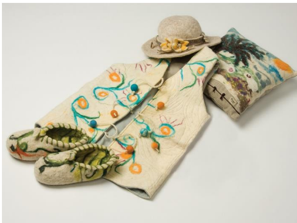
Slika 2. Proizvodi od creske vune