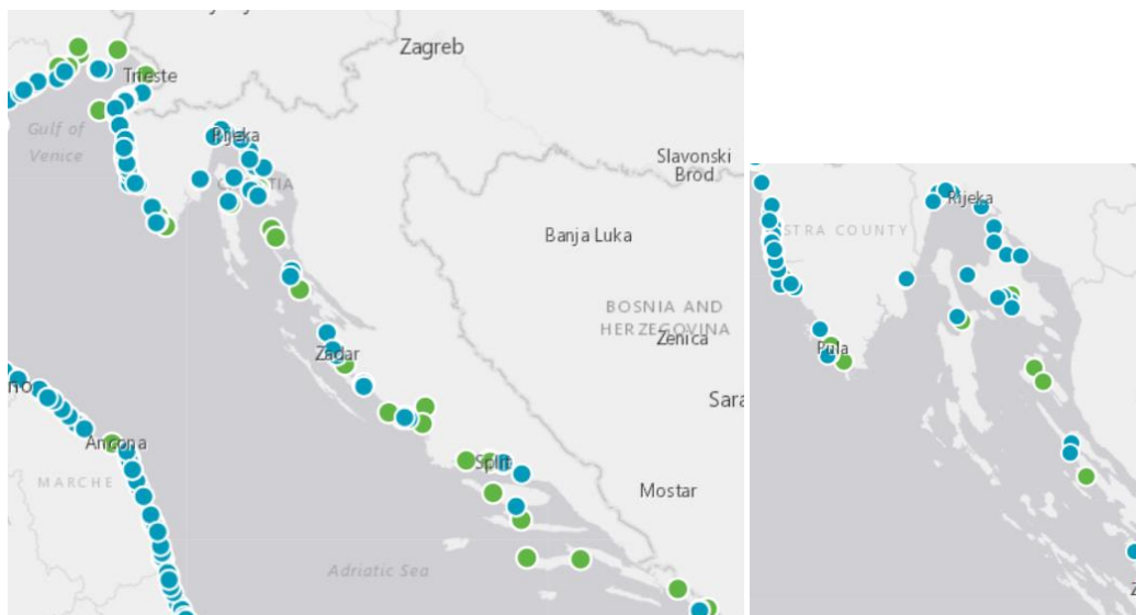
Slika 3. Marine i plaže u RH označene Plavom zastavom u 2022. godini