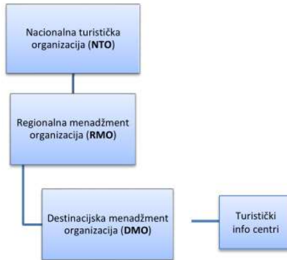
Slika 3 Razine upravljanja turizmom