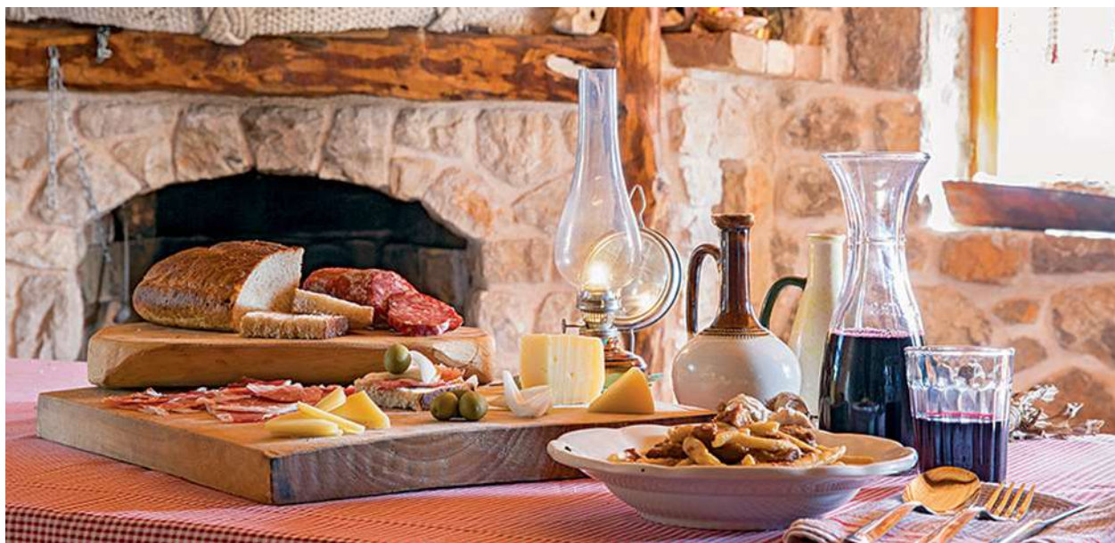
Slika 2. Gastronomska ponuda otoka Krka