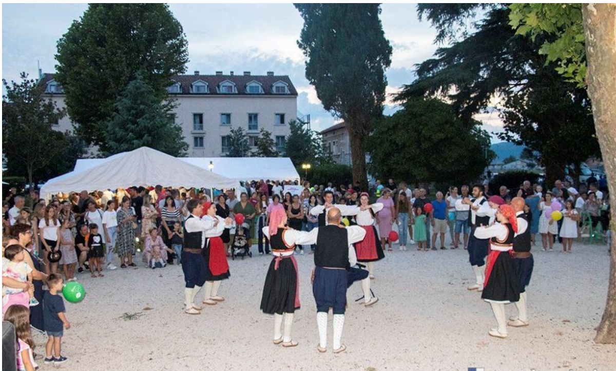
Slika 5. Festival tradicija, Metković