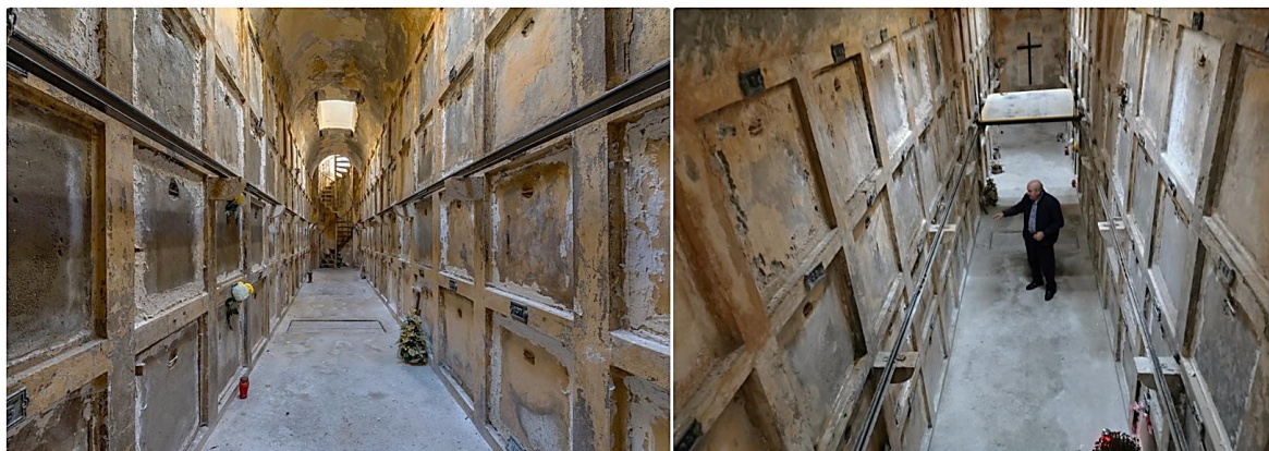
Slika 5. Katakombe u Sutivanu (Sutivan 2023; Radić 2020)

Sutivan. Široj javnosti je gotovo nepoznato da groblje u Sutivanu (na Braču) sadrži katakombe, što se smatra rijetkim primjerom sačuvanih podzemnih grobova na hrvatskom području. Sutivanske katakombe se nalaze u sklopu groblja čija je gradnja počela početkom 20. stoljeća, te trajala četiri godine. Nastanku katakombi je prethodila odluka i uredba nadležnih službi koje su utvrdile kako postojeće groblje nije više odgovaralo zdravstvenim propisima i higijenskim zahtjevima, nakon čega su mjesni crkveni službenici odlučiti preuzeti odgovornost za pronalazak rješenja. Izgradila se jama za katakombe u kojoj se danas nalazi ukupno 252 ukopnih mjesta, raspoređenih u dva odjeljka po četiri reda u visini, uz četiri otvora za ventilaciju i spuštanje mrtvacu (Radić 2020).