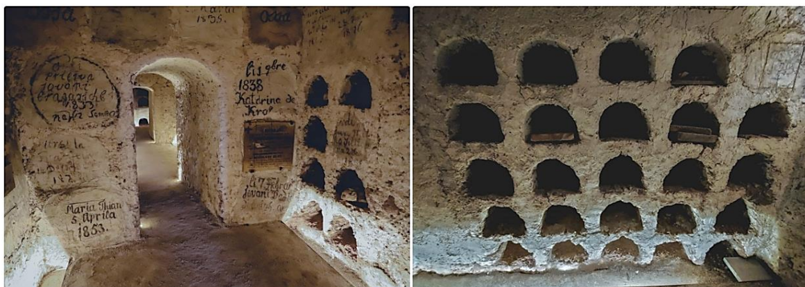
Slika 4. Katakombe u Senju (Ured za Blaga & Misterije 2021)

No, osim mjesta stradanja, mučenja i ubijanja postoje i potencijalna mjesta za turizam koja se prožimaju pričama, mitovima i legendama. U nekim hrvatskim destinacijama su se otkrila postojanja katakombi, poput Senja . Ispod staroga gradskog trga u Senju se nalaze kripte u kojima su se tijekom 60-ih godina 19. stoljeća sahranjivali mještani grada. Danas se u senjskim katakombama nalazi 200 grobova, među kojima se nalaze i poznatija imena grada koja su u prošlim stoljećima bila važnima za razvoj grada Senja na sjevernome Jadranu. S druge strane, ispod svetišta se nalazi kaptolska kripta u kojoj su sačuvani grobovi biskupa i kanonika. Prvi ukop u kripte se ostvario 1737. godine, dok se zadnji obavio 1868. godine, nakon čega su se zabranili ukopi u starogradskoj jezgri. Osim svrhe ukopa, za vrijeme Drugog svjetskog rata su se kripte koristile i kao zaštita od bombardiranja. Uz kripte se nalaze i druge zanimljivosti poput podatka da je na mjestu današnjeg senjskog trga nekada bilo pogansko svetište (Ured za Blaga & Misterije 2021).