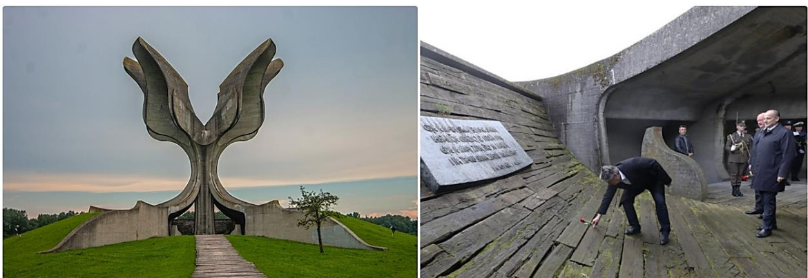
Slika 2. Jasenovac - lijevo: Spomenik Cvijet u Jasenovcu; desno: podno Spomenika (JUSP Jasenovac 2021; Poskok.info 2022)

Danas se pronalazi Spomen područje Jasenovac izgrađeno uz uže područje bivšeg koncentracijskog logora Jasenovac III - Ciglana. Na spomeničkom prostoru su označena mjesta autentičnih logorskih objekata i stratišta unutar samog logora. U području se pronalazi i spomenik Cvijet , autora Bogdana Bogdanovića, koji je bio podignut 1966. godine (Mikić 2021, 27).