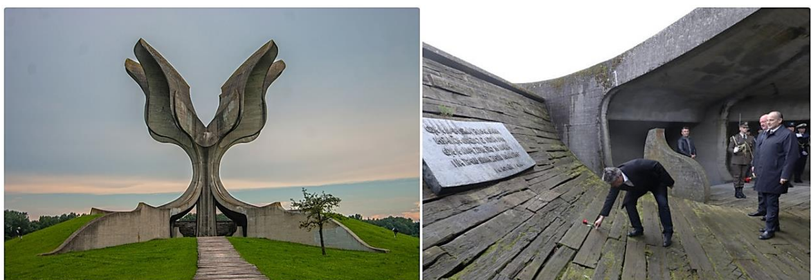
Slika 2. Jasenovac - lijevo: Spomenik Cvijet u Jasenovcu; desno: podno Spomenika (JUSP Jasenovac 2021; Poskok.info 2022)

Danas se pronalazi Spomen područje Jasenovac izgrađeno uz uže područje bivšeg koncentracijskog logora Jasenovac III - Ciglana. Na spomeničkom prostoru su označena mjesta autentičnih logorskih objekata i stratišta unutar samog logora. U području se pronalazi i spomenik Cvijet , autora Bogdana Bogdanovića, koji je bio podignut 1966. godine (Mikić 2021, 27).