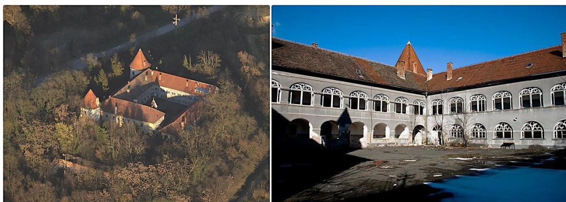
Slika 7. Dvorac Kerestinec (TZ Sveta Nedelja 2023; Tomaško 2014)

Osim destinacija s katakombama, u Hrvatskoj se nalaze i destinacije s dvorcima uz koje se vežu priče. Za potrebe ovoga rada će se izdvojiti Dvorac Kerestinec, spomenik kulture 1. kategorije čija je gradnja počela 1576. godine. Tijekom 18. i 19. stoljeća je ovaj renesansni kaštel s fortifikacijskim elementima bio pregrađivan, te je početkom 20. stoljeća bio temeljno uređen. Uz Dvorac se veže velebna ostavština obitelji Erdödy pod velom mračne prošlosti. Nakon što je Dvorac izgubio svoje vlasnike, postao je mjestom jeze i loših događaja koji su se tamo odvijali godinama. Prije Drugog svjetskog rata je dvorac bio u funkciji koncentracijskog logora, dok se nakon rata u njemu smjestila vojska. Mračni osjećaj se vezao uz ovu građevinu i početkom 90-godina kada je Kerestinec postao ozloglašeno mjesto u koje su dovodili ratne zarobljenike koji su bili brutalno mučeni u crnoj sobi, izloženi svakakvim poniženjima, dok su zarobljene žene bile i seksualno zlostavljane. Taj su dvorac zvali Konačištem ratnih zarobljenika (Sjeverni.info 2018).