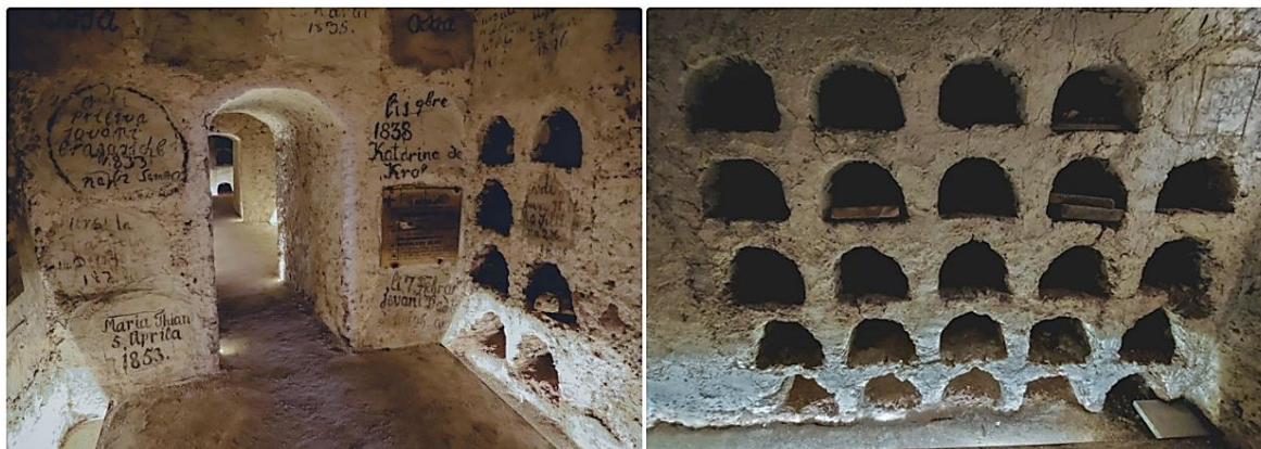
Slika 4. Katakombe u Senju (Ured za Blaga & Misterije 2021)

No, osim mjesta stradanja, mučenja i ubijanja postoje i potencijalna mjesta za turizam koja se prožimaju pričama, mitovima i legendama. U nekim hrvatskim destinacijama su se otkrila postojanja katakombi, poput Senja . Ispod staroga gradskog trga u Senju se nalaze kripte u kojima su se tijekom 60-ih godina 19. stoljeća sahranjivali mještani grada. Danas se u senjskim katakombama nalazi 200 grobova, među kojima se nalaze i poznatija imena grada koja su u prošlim stoljećima bila važnima za razvoj grada Senja na sjevernome Jadranu. S druge strane, ispod svetišta se nalazi kaptolska kripta u kojoj su sačuvani grobovi biskupa i kanonika. Prvi ukop u kripte se ostvario 1737. godine, dok se zadnji obavio 1868. godine, nakon čega su se zabranili ukopi u starogradskoj jezgri. Osim svrhe ukopa, za vrijeme Drugog svjetskog rata su se kripte koristile i kao zaštita od bombardiranja. Uz kripte se nalaze i druge zanimljivosti poput podatka da je na mjestu današnjeg senjskog trga nekada bilo pogansko svetište (Ured za Blaga & Misterije 2021).