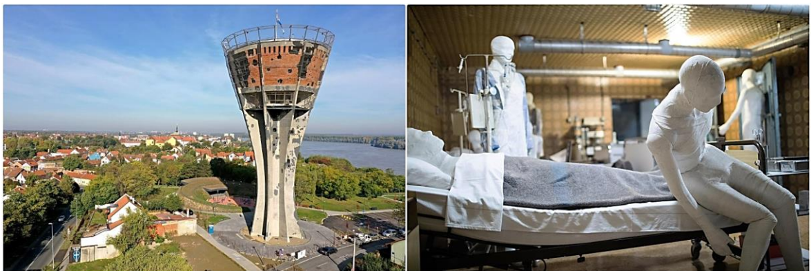
Slika 1. Vukovar - lijevo: Vukovarski vodotoranj; desno: Mjesto sjećanja - Vukovarska bolnica: podrum (Perić 2020; Elvedji 2021)