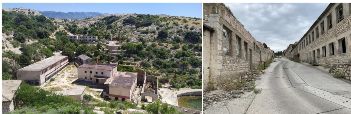
Slika 3. Goli Otok - kaznionica (Maglajlija 2021; Elia 2020)

Cilj ovih kaznionica je bio izbrisati svaki trag humanosti u zatvorenicima kroz užasne oblike kažnjavanja, teški fizički rad i nehumane uvjete života. Zatvorenici su umirali na različite načine - neki počinili samoubojstva, neki pretučeni na smrt, neki prilikom pokušaja bijega, dok su drugi umirali od gladi i iscrpljenosti. Prije ove funkcije, otok je bio nenaseljen i prazan, te su ga izgradili i pošumili upravo zatvorenici, te od njega napravili prostor za život. Zbog njegovog povoljnog položaja kao kaznionice, bijeg s otoka je bio nemoguć, a otežavali su ga strogi nadzor, jake morske struje i udaljenost od obale (Šerić 2017, 18).