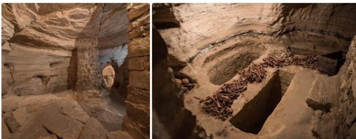
Slika 6. Katakombe u Kistanju (Esenko 2018; National park Krka. 2023)

Osim destinacija s katakombama, u Hrvatskoj se nalaze i destinacije s dvorcima uz koje se vežu priče. Za potrebe ovoga rada će se izdvojiti Dvorac Kerestinec, spomenik kulture 1. kategorije čija je gradnja počela 1576. godine. Tijekom 18. i 19. stoljeća je ovaj renesansni kaštel s fortifikacijskim elementima bio pregrađivan, te je početkom 20. stoljeća bio temeljno uređen. Uz Dvorac se veže velebna ostavština obitelji Erdödy pod velom mračne prošlosti. Nakon što je Dvorac izgubio svoje vlasnike, postao je mjestom jeze i loših događaja koji su se tamo odvijali godinama. Prije Drugog svjetskog rata je dvorac bio u funkciji koncentracijskog logora, dok se nakon rata u njemu smjestila vojska. Mračni osjećaj se vezao uz ovu građevinu i početkom 90-godina kada je Kerestinec postao ozloglašeno mjesto u koje su dovodili ratne zarobljenike koji su bili brutalno mučeni u crnoj sobi, izloženi svakakvim poniženjima, dok su zarobljene žene bile i seksualno zlostavljane. Taj su dvorac zvali Konačištem ratnih zarobljenika (Sjeverni.info 2018).