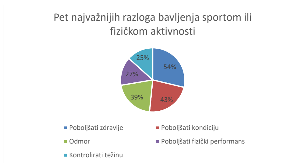
Grafikon 1.: Pet najvažnijih razloga bavljenja sportom ili fizičkom aktivnosti