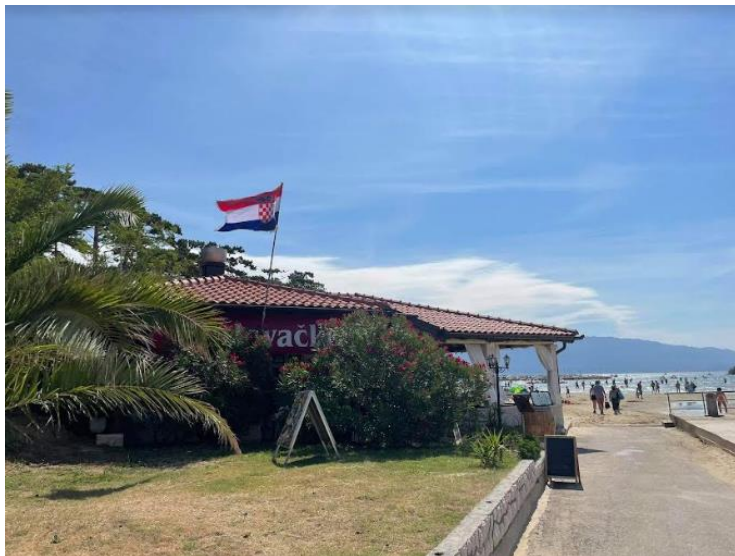
Slika 4. Prilaz restoranu Bonaca