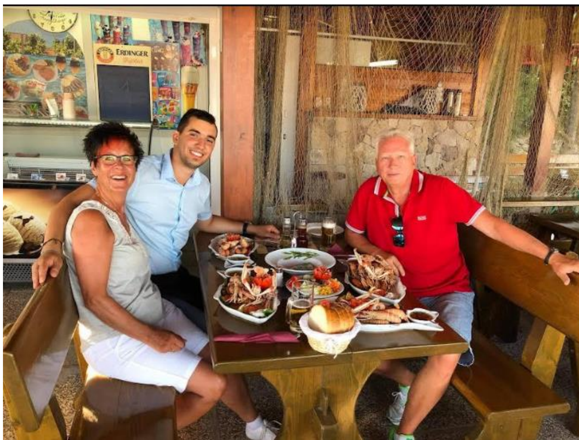
Slika 8. Posluživanje škampa

Škampi se nakon ulova direktno dovoze u restoran te se grupiraju u porcije. Na taj način gosti mogu pratiti način pripreme tako da su sto posto sigurni da su na meniju svježi živi vlastito ulovljeni škampi. Škampe se poslužuje na nekoliko načina, a to su u restoranu najpoznatiji način veliki škampi na žaru gdje se podrazumijeva desetak velikih škampi pripremljenih na žaru te uz njih poslužuje domaći češnjak sa maslinovim uljem što je prikazano na slici 8.