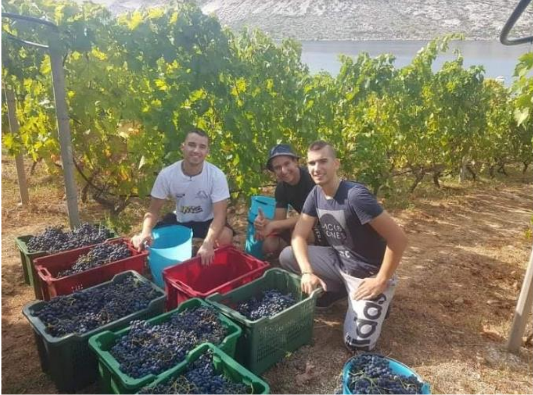
Slika 9. Berba grožđa