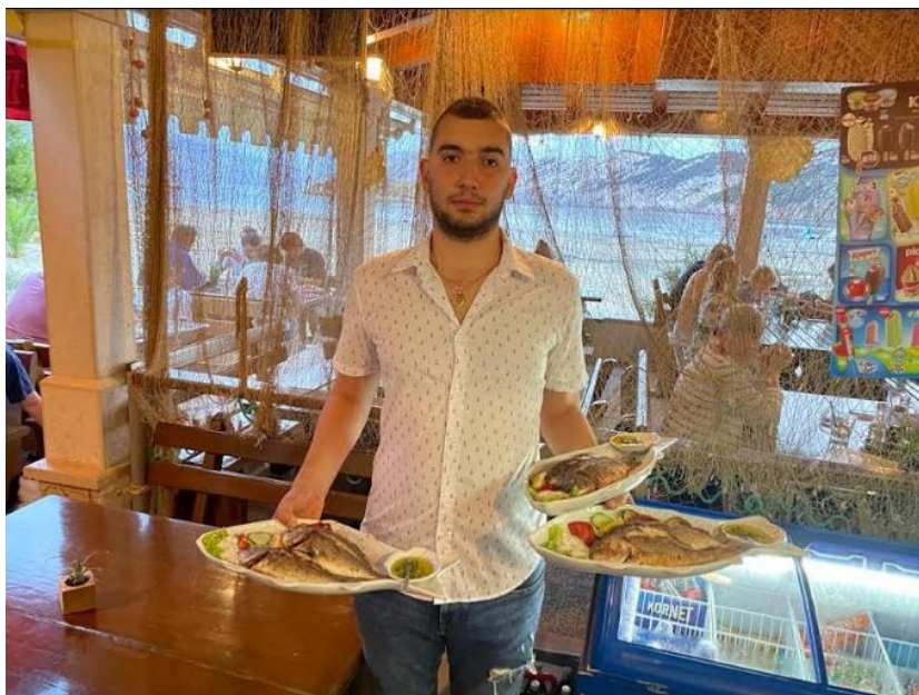
Slika 5. Ponuda restorana Bonaca

Na slici 5. je prikazana ponuda restorana Bonaca.