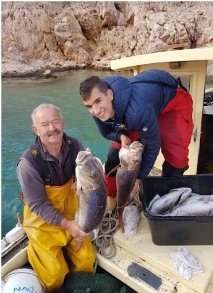
Slika 10. Dodatna ponuda restorana Bonaca