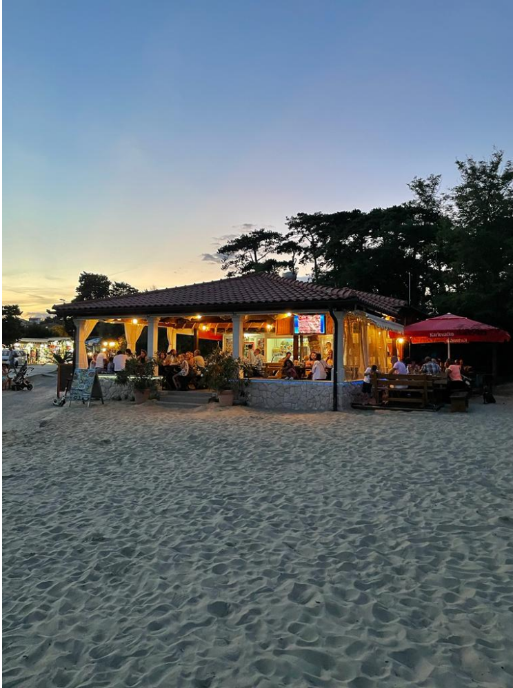
Slika 3. Restoran Bonaca