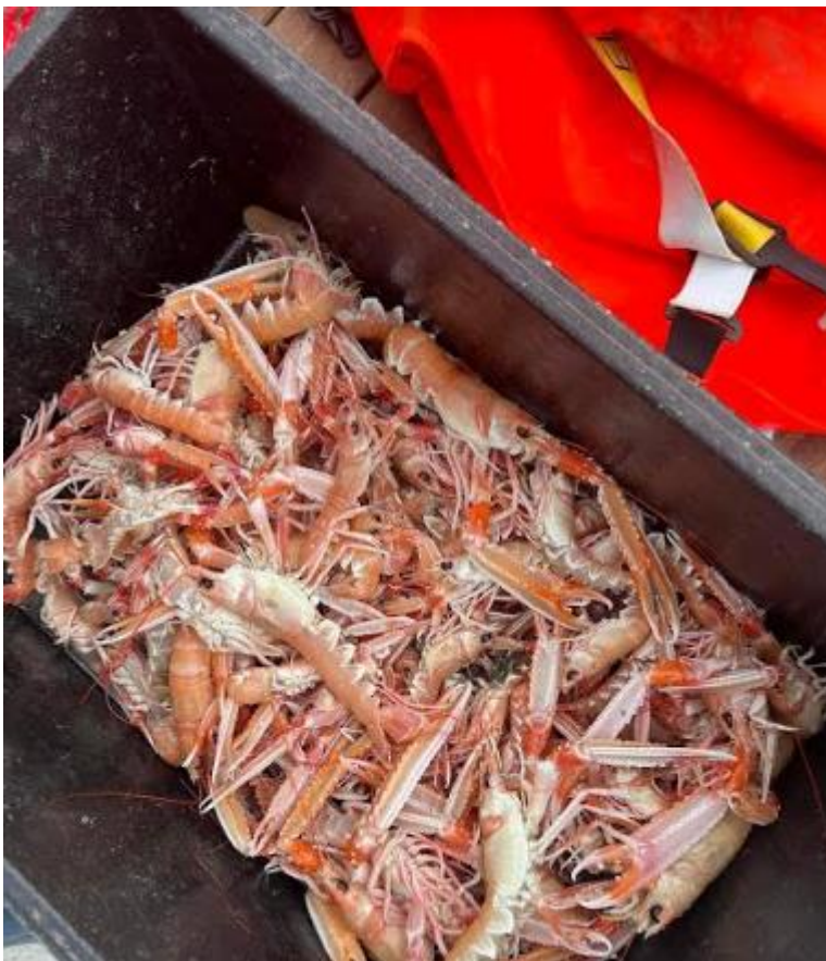
Slika 7. Lov škampa