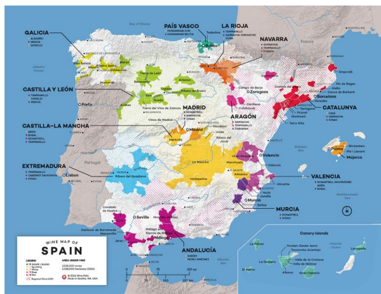
Slika 8. Vinske regije u Španjolskoj

Valencia - Sunčana istočna obala Španjolske nudi pjeskovito i vapnencem bogato tlo, idealan teritorij za uzgoj sorte grožđa Monastrell i proizvodnju voćnih crnih vina. Najpoznatija pod regija, Utiel-Requena, proizvodila je međunarodno nagrađivana vina. Glavna sorta grožđa, Bobal, ishodište je odvažnih crnih vina, ali i strukturirana rosea i pjenušavih vina. Španjolska je treći najveći proizvođač vina s najvećom površinom pod vinogradima na svijetu. (2,4 milijuna hektara). Španjolska vina variraju od velikih vrijednosti do kolekcionarskih blaga, te od delikatnih bijelih do raskošnih crvenih. U Španjolskoj postoji 138 službenih oznaka vina. Regije su poprilično raznolike, proizvode sve od pikantnog Albariña do crnog Monastrell boje e tinte. 17