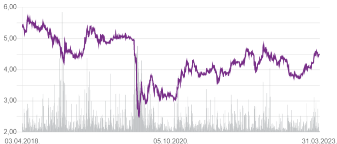
Slika 1 Kretanje cijene dionice Valamar Riviera u zadnjih pet godina