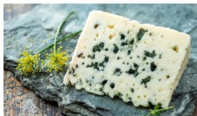
Photo n°4 : Le roquefort

Source 4 : https://gastro.24sata.hr/kolumne/roquefort-sir-kraljeva-i-papa-26659 (téléchargé le 18 juin 2023)