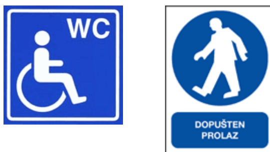
Slika 6. Znakovi obveza, dozvola i pristupačnosti za invalide

Plave boje s bijelim natpisom označeni su znakovi obveza, dozvola i pristupačnosti za invalide koji, kao što i sam naziv govori, upućuju na obvezno i dozvoljeno ponašanje u prostoru te na pristupačnost za osobe s invaliditetom.