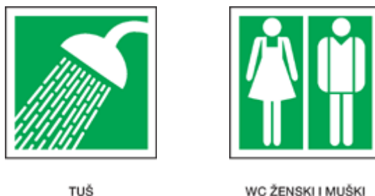
Slika 4. Znakovi informacija

Znakovi informacija zelene su boje pravokutnog ili kvadratnog oblika. Njihova je svrha osvijestiti ispravno ponašanje kod gosta te pružanje općih informacija o prostoru.