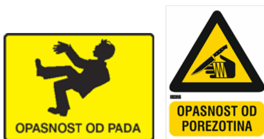
Slika 2. Znakovi opasnosti