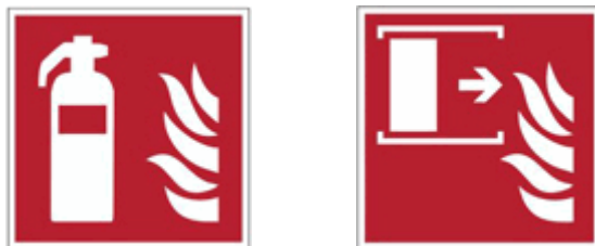
Slika 5. Znakovi sigurnosti zaštite od požara

Znakovi sigurnosti zaštite od požara prikazani u obliku kvadrata crvene boje te označavaju mjesta na kojima se nalazi aparat za gašenje požara, ali i ispravno ponašanje ukoliko dođe do takve situacije.