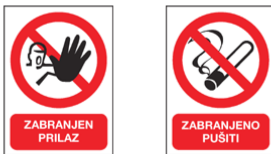
Slika 3. Znakovi zabrane

Znakovi zabrane prikazani su u obliku kruga crvene boje, a upućuju na zabranu ponašanja koje može biti uzrok neželjenog utjecaja na ljudsko zdravlje ili sigurnost osoba.