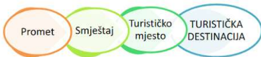
Slika 1. Matrica razvoja turizma

raspolože i njegovom implementacijom kao pravog proizvoda za pravog turista. Već se spomenulo da destinacija ne mora biti grad, već neki veći proctor, regija ali i država. Za preduvjet razvoja destinacije potrebno je nekoliko stavki, u nastavku je prikazana matrica razvoja turizma: