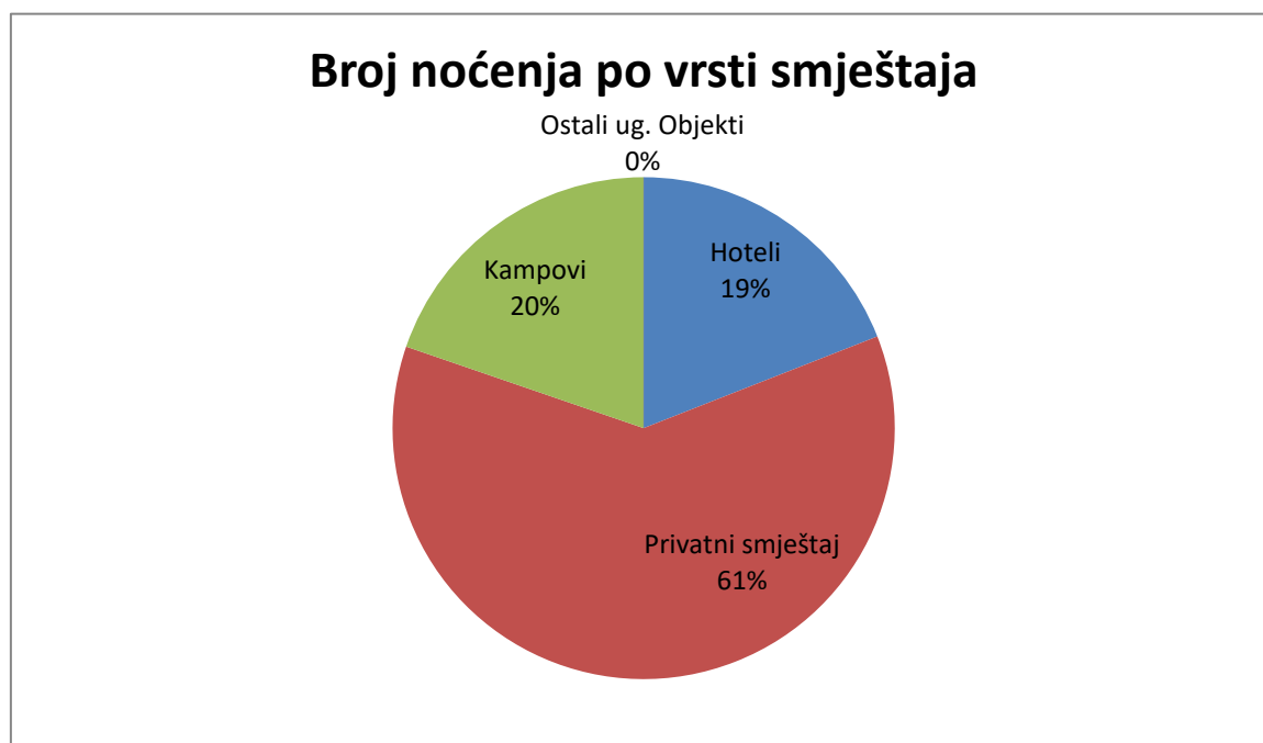
Grafikon 2. Broj noćenja po vrsti smještaja

U sljedećem grafu će se prikazati broj noćenja po vrsti smještaja.