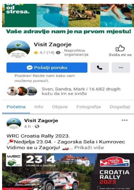
Slika 4. Prikaz profila na Facebooku