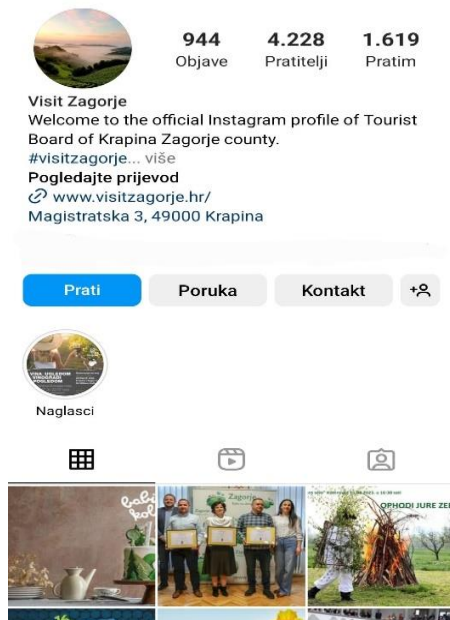
Slika 5. Prikaz Instagram profila