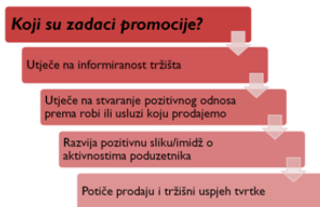
Slika 1. Zadaci promocije