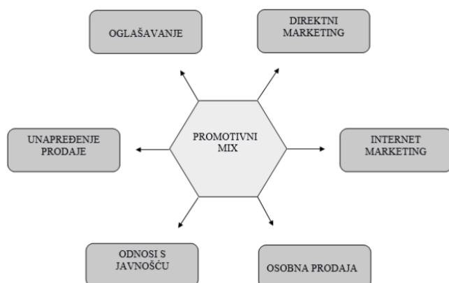
Slika 2. Elementi promotivnog miksa