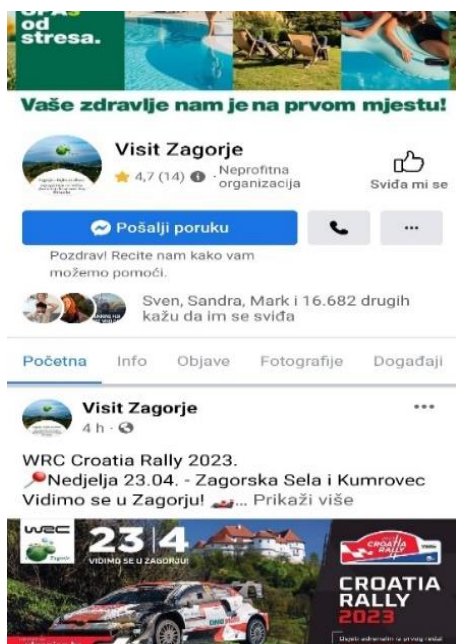
Slika 4. Prikaz profila na Facebooku