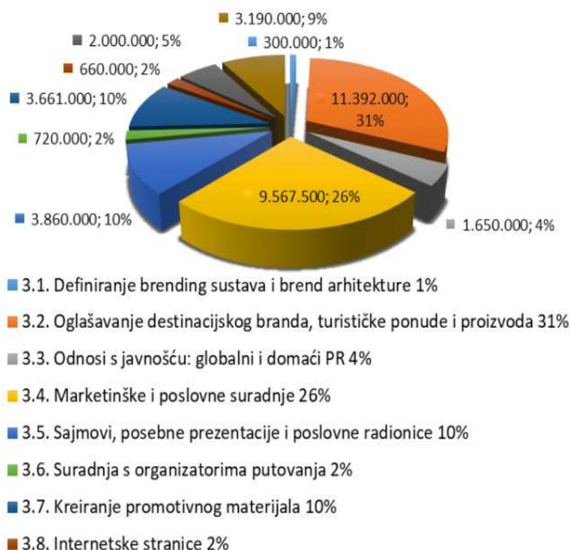
Grafikon 1. Aktivnosti Turističke zajednice grada Zagreba vezane uz promociju