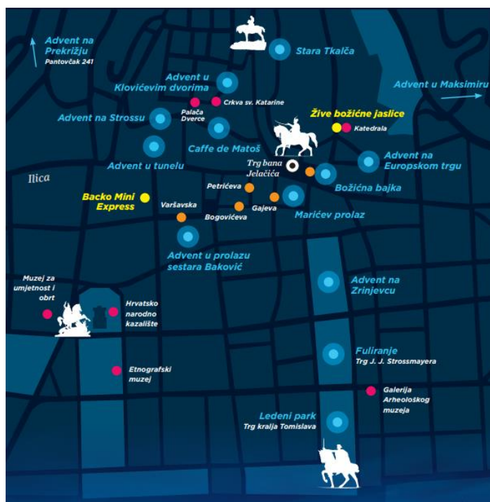
Slika 6. Lokacije Adventa u Zagrebu