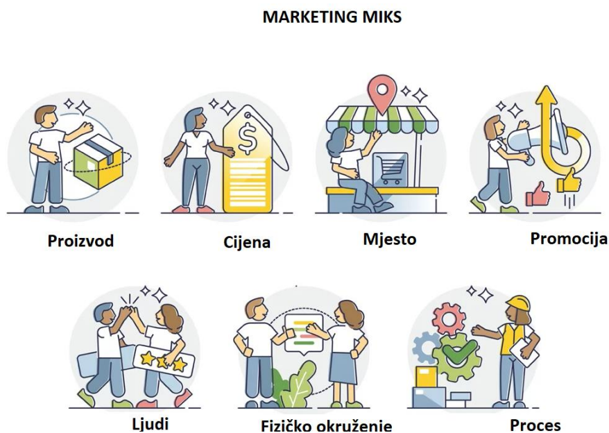
Slika 2. 7 P marketing miks