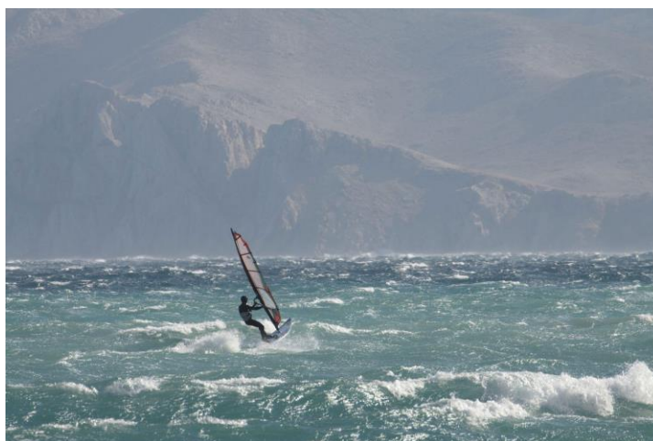
Slika 2. Windsurfing u Baški