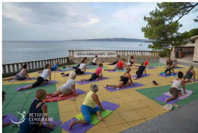
Slika 1. Activity Center Krk, otvoreno vježbalište u gradu Krku