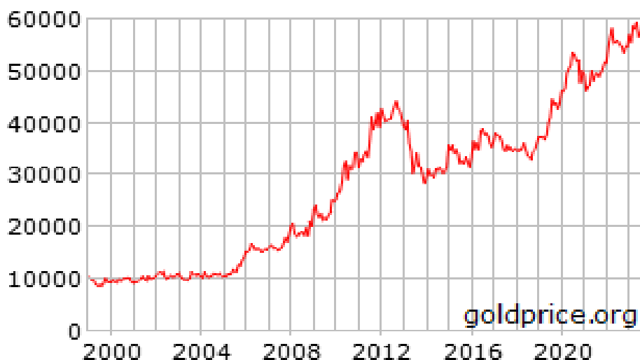
Slika 4. Kretanje cijena zlata u razdoblju od 2000. do 2023. godine