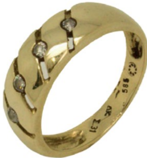
Slika 3. Primjer oznake čistoće na prstenu od zlata stupnja čistoće 585/1000