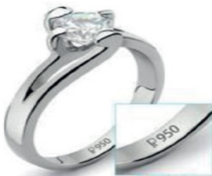
Slika 2. Primjer oznake čistoće na prstenu od platine stupnja čistoće 950/1000