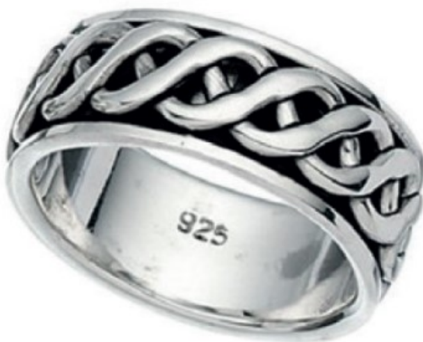
Slika 1. Primjer oznake čistoće na prstenu od srebra stupnja čistoće 925/1000