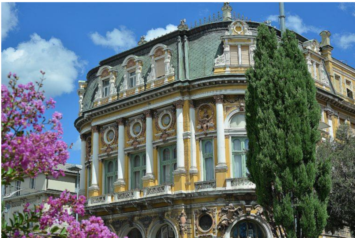
Immagine 7. Il Palazzo Modello di Fiume

I famosi architetti Ferdinand Fellner e Herman Helmer, già autori del progetto del teatro di Fiume “Ivan Zajc”, progettaron anche la sede di Palazzo Modello, costruito tra il 1883 e il 1885, con destinazione d’uso sia commerciale che residenziale. Il palazzo è influenzato dalle correnti neobarocche e rinascimentali, essendo ricco di ornamenti scultorei a rilievo, colonne corinzie e abbaini. Il palazzo ospita la Comunità degli Italiani di Fiume dal 1946; al piano nobile è ubicata la sede sociale, comprendente il salone delle feste e dello svolgimento di eventi culturali di ogni genere, il bar, la segreteria, la biblioteca con oltre 10.000 volumi, la sala di lettura, quella delle mostre e altre sale multifunzionali. Il terzo ed il quarto piano dell’edificio comprendono le aule della Scuola Modello per i corsi di lingua e gli appositi spazi del Centro Studi di Musica Classica “Luigi Dallapiccola”, corsi di musica specializzati in pianoforte e flauto. Vi sono, inoltre, anche situati i vani per le prove delle sezioni corali e dei cantanti solisti, la sezione delle arti figurative e, infine, altre sale minori per riunioni e svariate attività 21 .