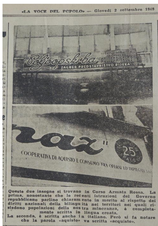
Immagine 4. Bilinguismo a Fiume

Fino al secondo conflitto mondiale, l'Italia sotto il fascismo rendeva obbligatorio a Fiume l'uso esclusivo dell'italiano. A partire dal maggio del 1945, invece, successivamente all'entrata in città delle truppe jugoslave, lo sfondo linguistico di Fiume comincia ad apparire alquanto indefinito. Sui muri della città erano ancora visibili alcuni avanzi delle scritte in italiano del periodo fascista. Contestualmente cominciarono a palesarsi iscrizioni in lingua croata regolanti la nuova vita sociale. Dal 1948 le targhe del centro della città cominciano ad essere bilingui (in croato e italiano); ma, già a partire da un paio di anni più tardi, verso l'inizio degli anni Cinquanta le targhe bilingui cominciano via via a scemare, così come la presenza degli italiani presenti a Fiume.