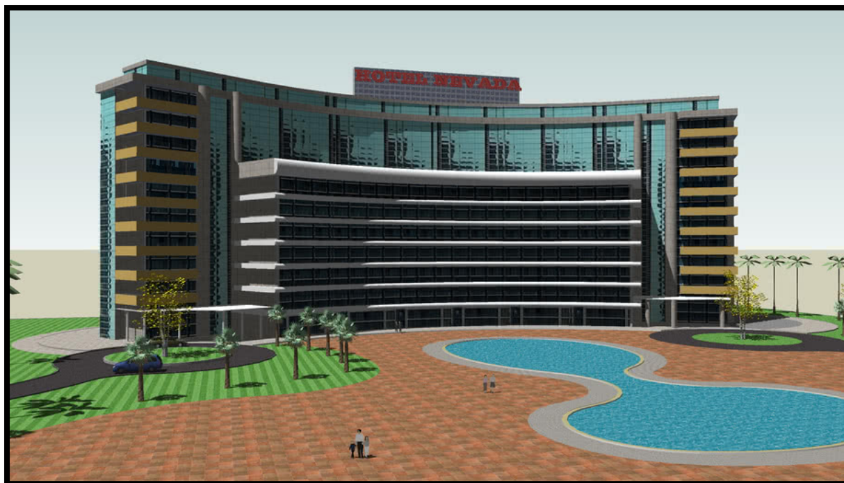
Slika 1. Prikaz 3D modela hotela unutar aplikacije