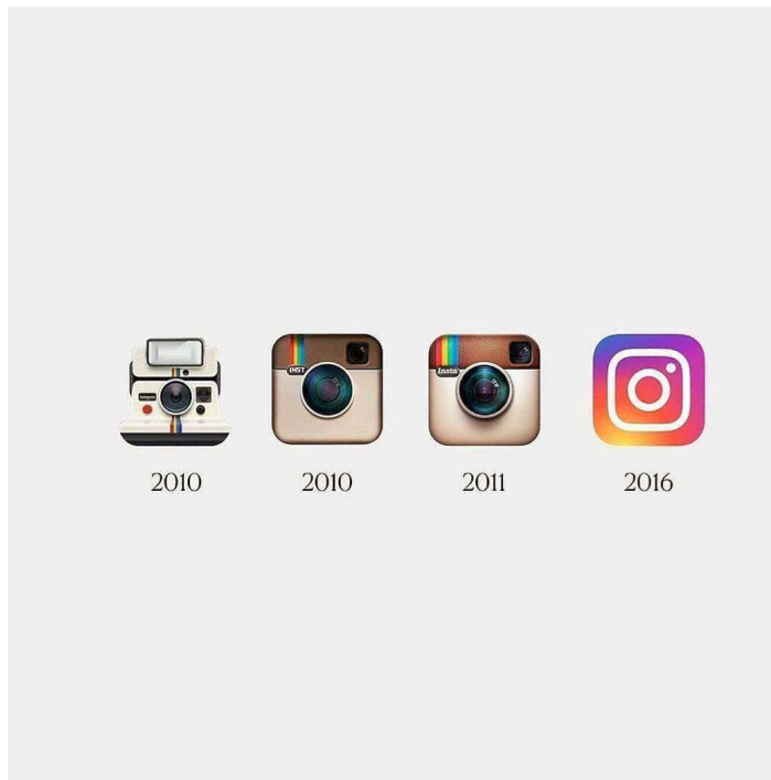
Slika 2. Evolucija Instagram loga