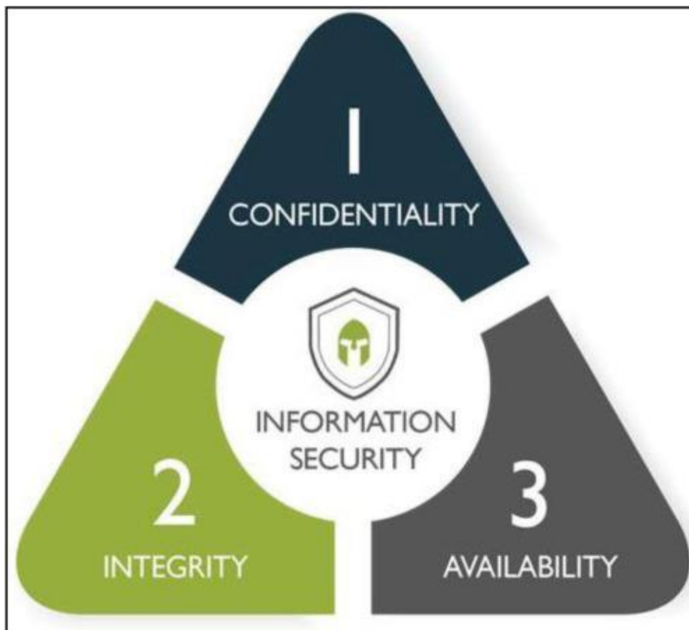
Slika 5. Vrste kibernetičke sigurnosti