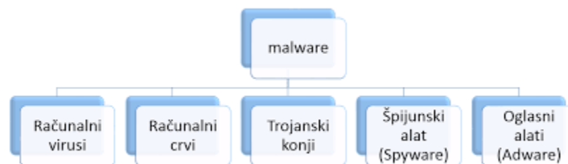
Slika 3. Zlonamjerni programi